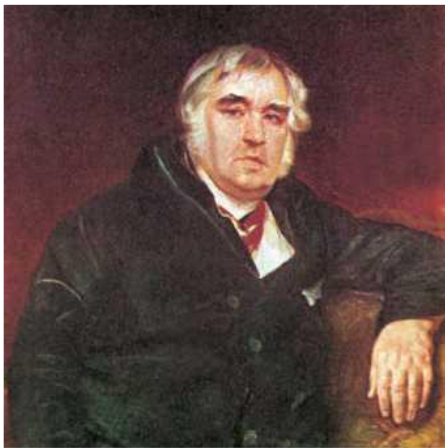
ИВАН АНДРЕЕВИЧ КРЫЛОВ Баснописец