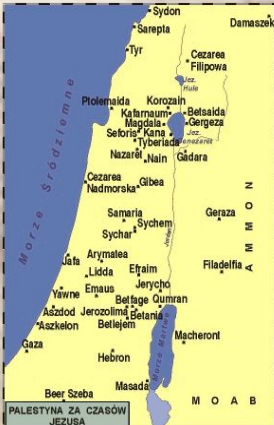
PALESTYNA ZA CZASÓW JEZUSA