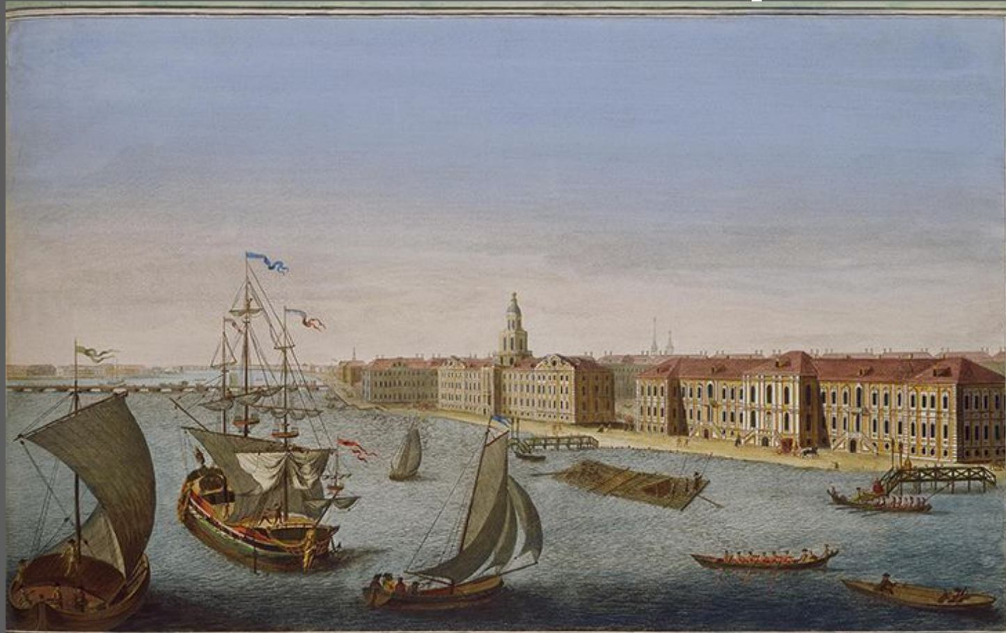
Vue des bords de la Neva en descendant la riviere entre le Palais d'hiver de Sa Majesté Imperiale & les batimens de l'Academie des Sciences.

Рассмотрите иллюстрацию. Какие здания сохранились до наших дней? Запишите в тетрадь