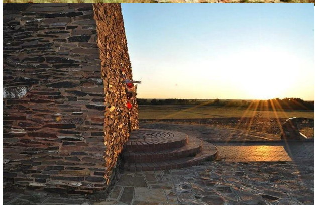
Ямышевские крепостные ворота