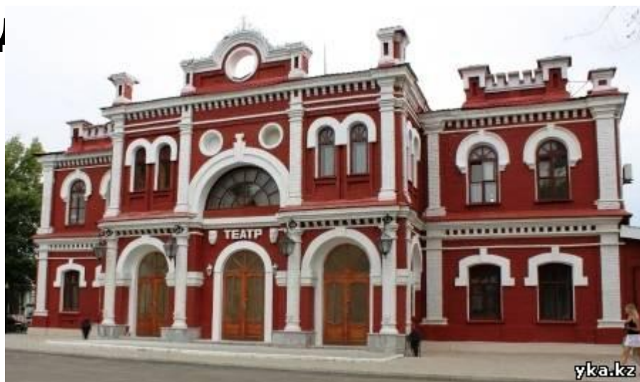
Областной драматический театр им. Жамбыла в Усть-Каменогорске

В области имеются вузы, средне-специальные учебные заведения, стадионы, Дворец Спорта, парки отдыха, работают библиотеки, кинотеатры, клубы, музеи, в Усть-Каменогорске работает драматический театр; в Семипалатинске