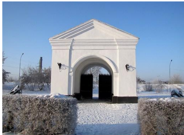
Ямышевские крепостные ворота