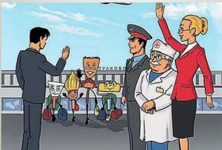
Иллюстрация из Справочника мигранта. Спб., 2014