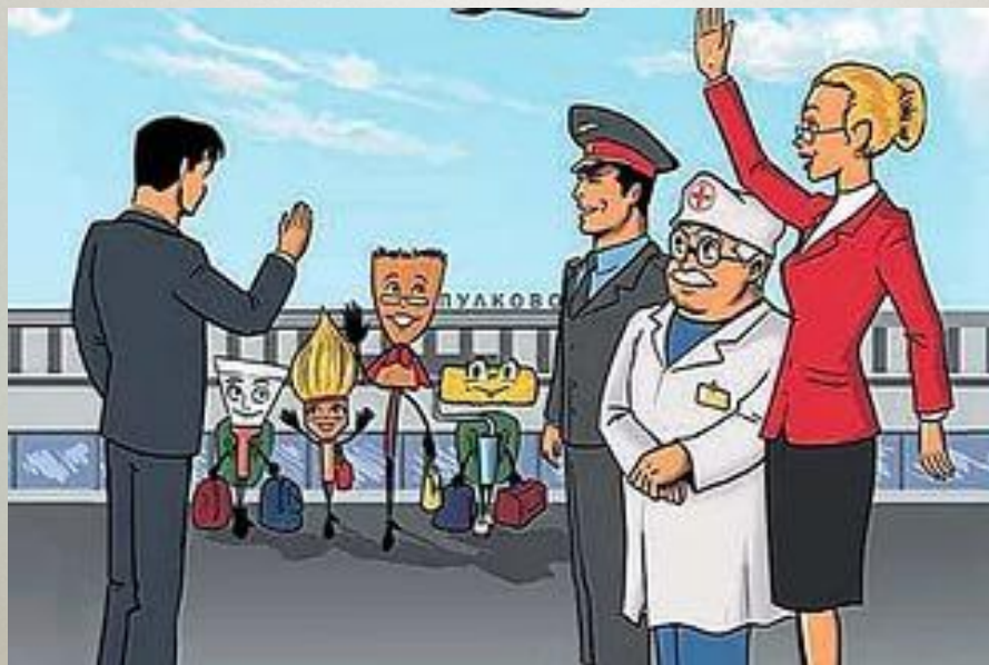
Иллюстрация из Справочника мигранта. Спб., 2014