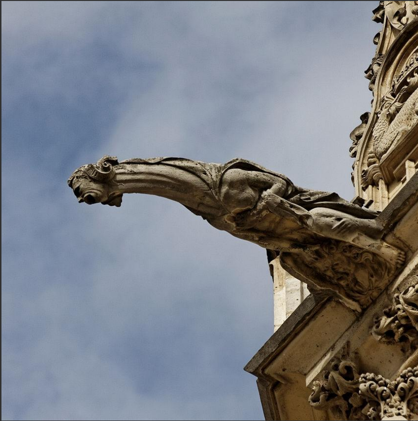
Венсанский замок, (Франция)

Гаргулья, также гаргуйль (фр. gargouille ) и горгулья — в готической архитектуре: каменный или металлический выпуск водосточного жёлоба, чаще всего скульптурно оформленный в виде гротескного персонажа (иногда — многофигурного сюжета) и предназначенный для эффективного отвода дождевого стока от вертикальных поверхностей ниже свеса кровли.