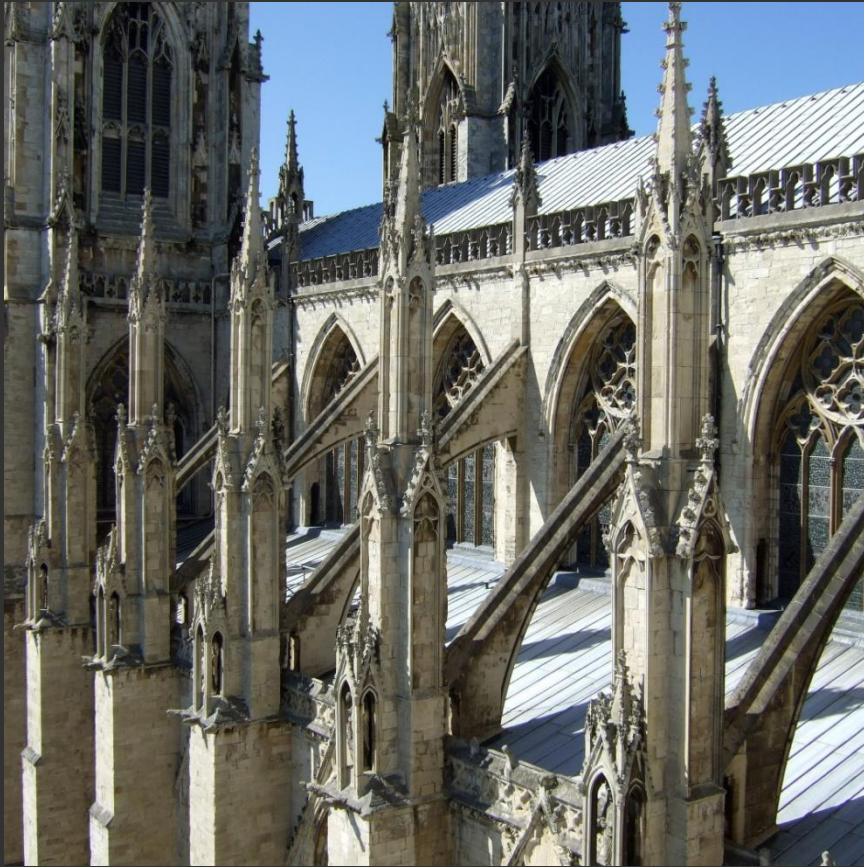
Йоркский собор в Йорке

Контрфорс (фр. contre force — «противодействующая сила») — вертикальная конструкция, представляющая собой либо выступающую часть стены, либо вертикальное ребро, либо отдельно стоящую опору, связанную со стеной аркбутаном. Предназначена для усиления несущей стены путём принятия на себя горизонтального усилия распора от сводов. Внешняя поверхность контрфорса может быть вертикальной, ступенчатой или непрерывно наклонной, увеличивающейся в сечении к основанию.