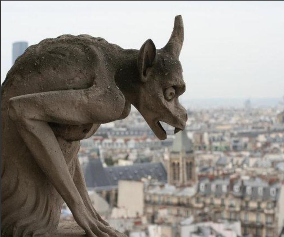
Собор Парижской Богоматери, Париж, (Франция)

Химера (греч. Χίμαιρα, «коза») — в греческой мифологии чудовище с головой и шеей льва, туловищем козы, хвостом в виде змеи; порождение Тифона и Ехидны. Распространенный скульптурный мотив в виде устрашающих чудовищ, венчающие внешние своды или фасады готических соборов.