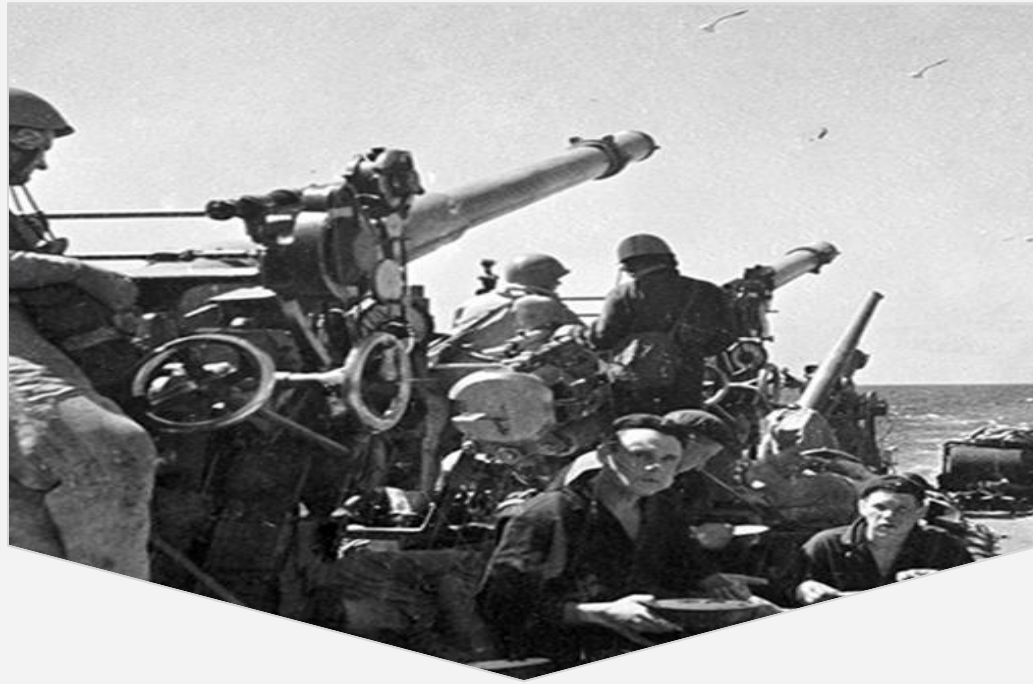
Битва за Одесу 1941 року