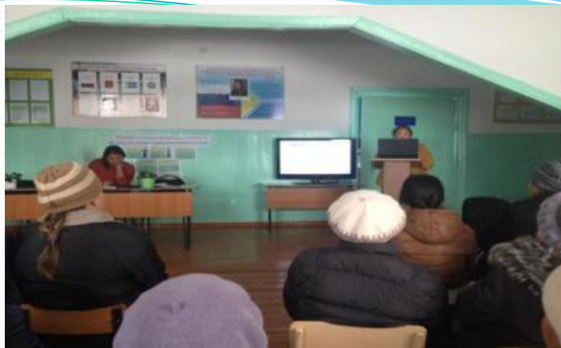
Общешкольное родительское собрание