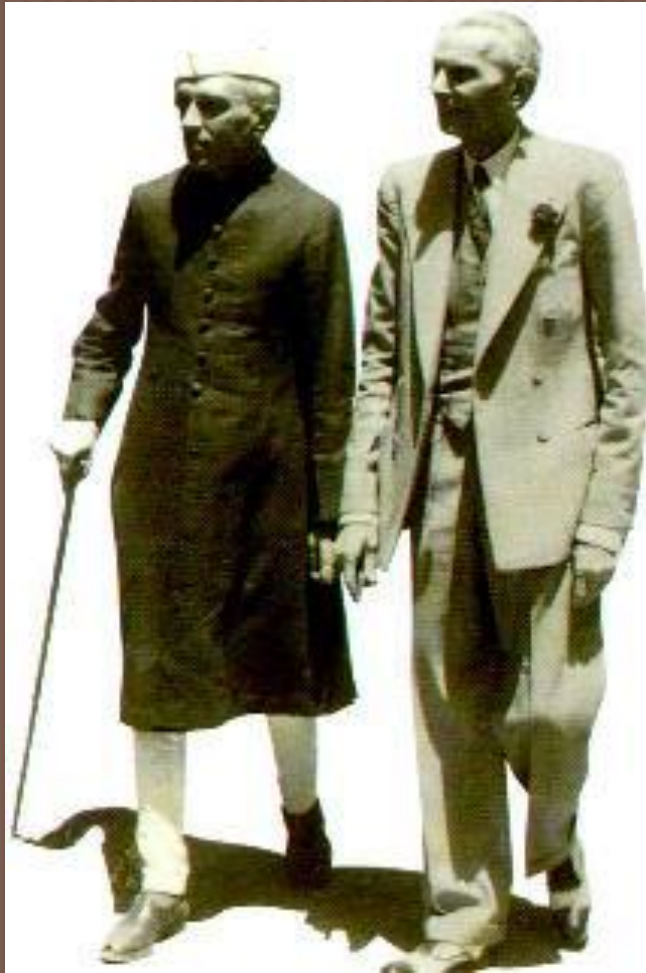
Дж.Неру и лидер Пакистана Джинни

ПОСЛЕ ВТОРОЙ МИРОВОЙ ВОЙНЫ В ИНДИИ ВОЗОБНОВИЛОСЬ ОСВОБОДИТЕЛЬНОЕ ДВИЖЕНИЕ.