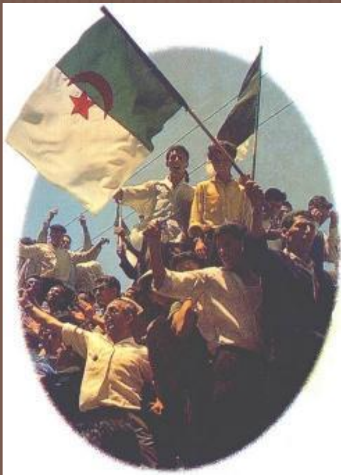
Провозглашение независимости Алжира

БОРЬБА НАРОДОВ АФРИКИ ЗА НЕЗАВИСИМОСТЬ НАЧАЛАСЬ ЕЩЕ В 20-Е ГОДЫ XX ВЕКА.