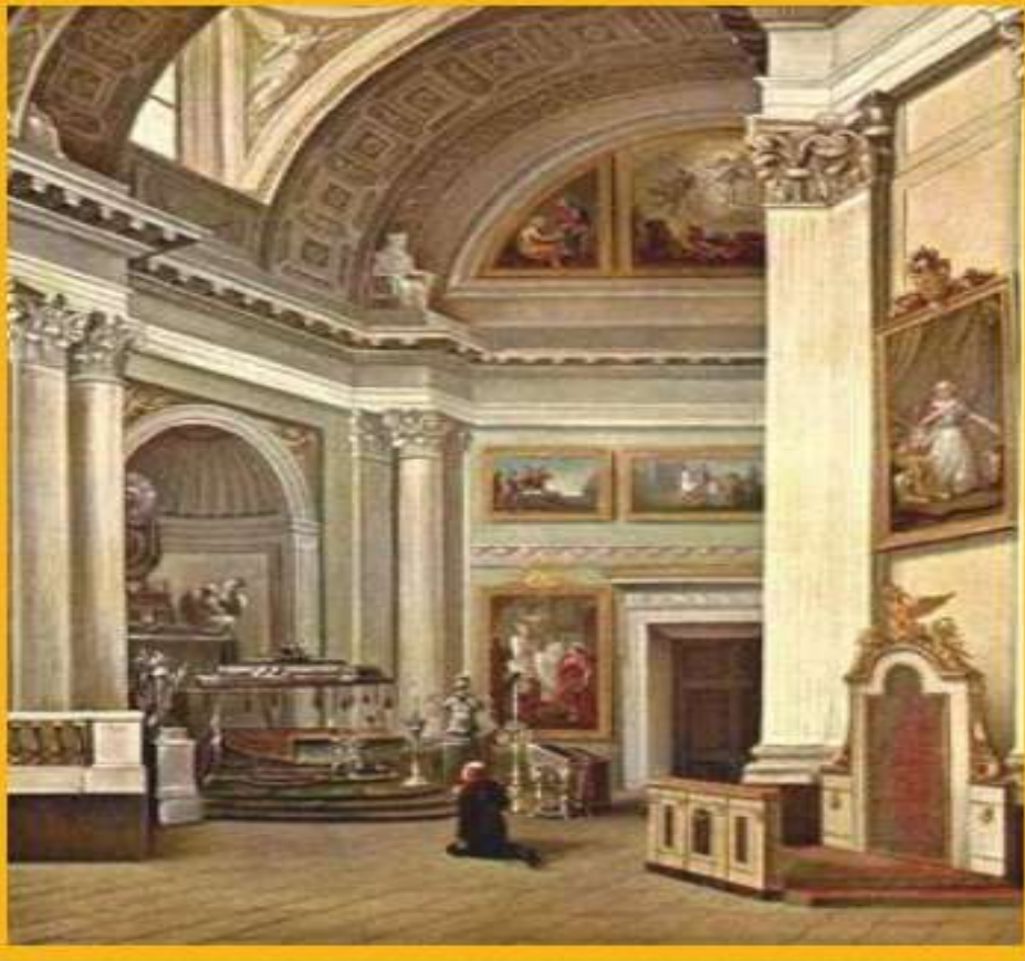
Александр 1 на богомолье в Александро-Невской лавре.

Причины неудачи реформ лежали в следующем: