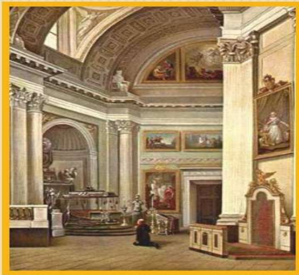
Александр 1 на богомолье в Александро-Невской лавре.

Причины неудачи реформ лежали в следующем: