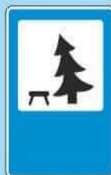
7.11 "Место отдыха"