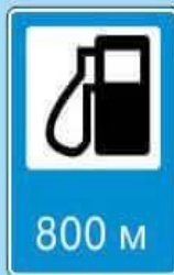
7.3 "Автозаправочная станция"