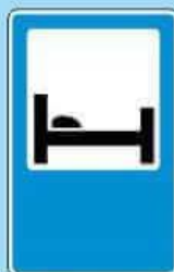
7.9 "Гостиница или мотель"