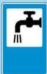
7.8 "Питьевая вода"