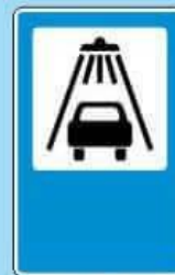
7.5 "Мойка автомобилей"