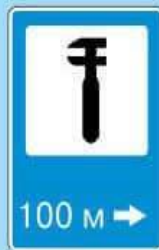
7.4 "Техническое обслуживание автомобилей"