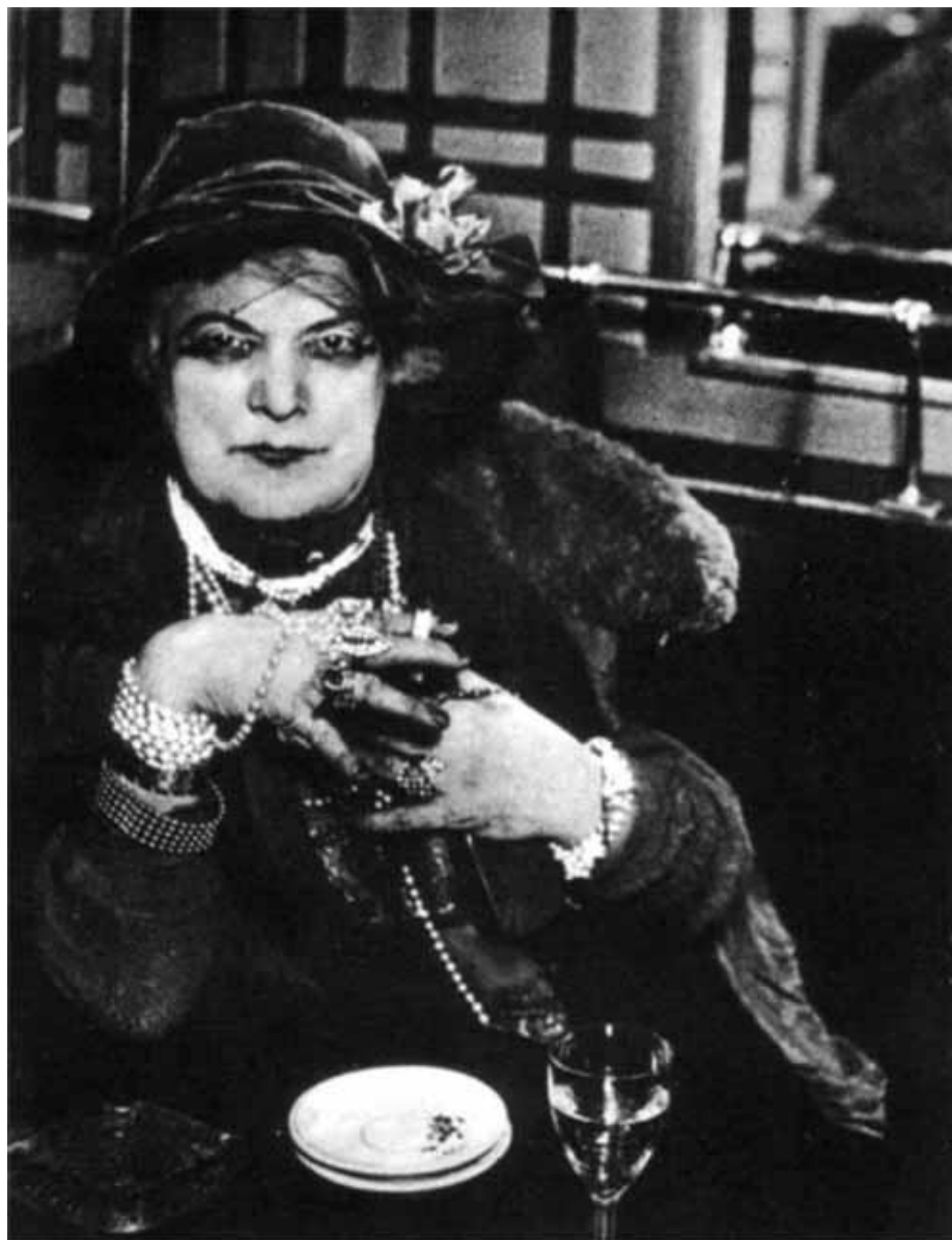
Драгоценность в баре Плас Пигаль. 1932