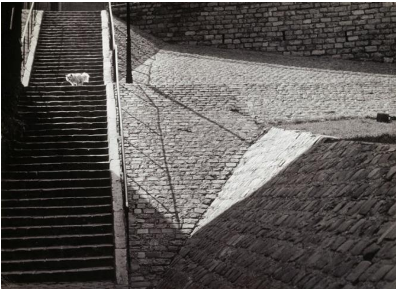
«Собака на лестнице», 1932