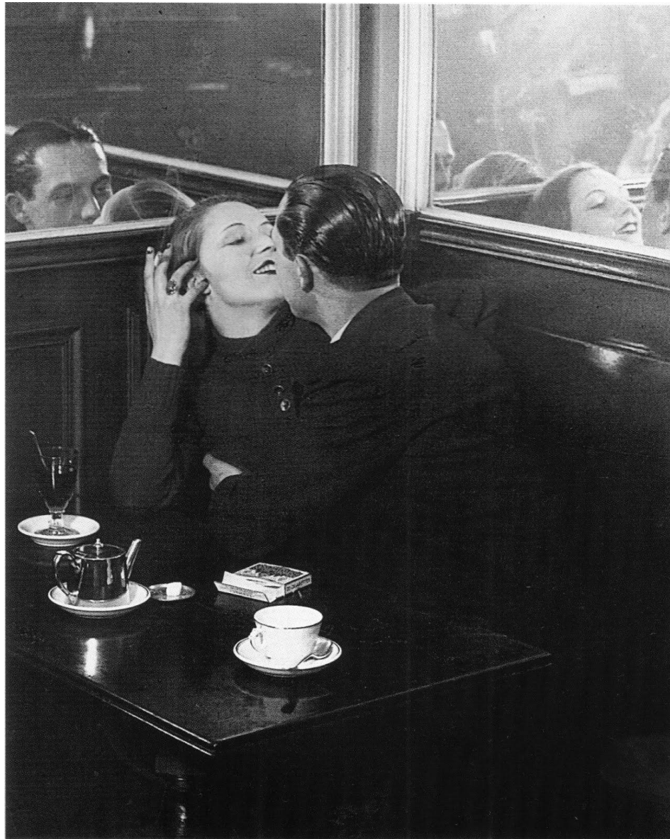
Couple d'amoureux, Place d'Italie. 1932