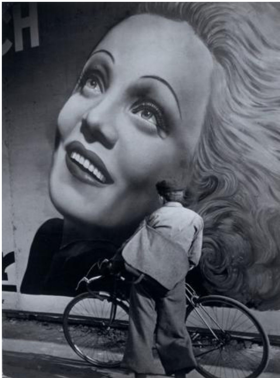
«Марлен Дитрих», 1937