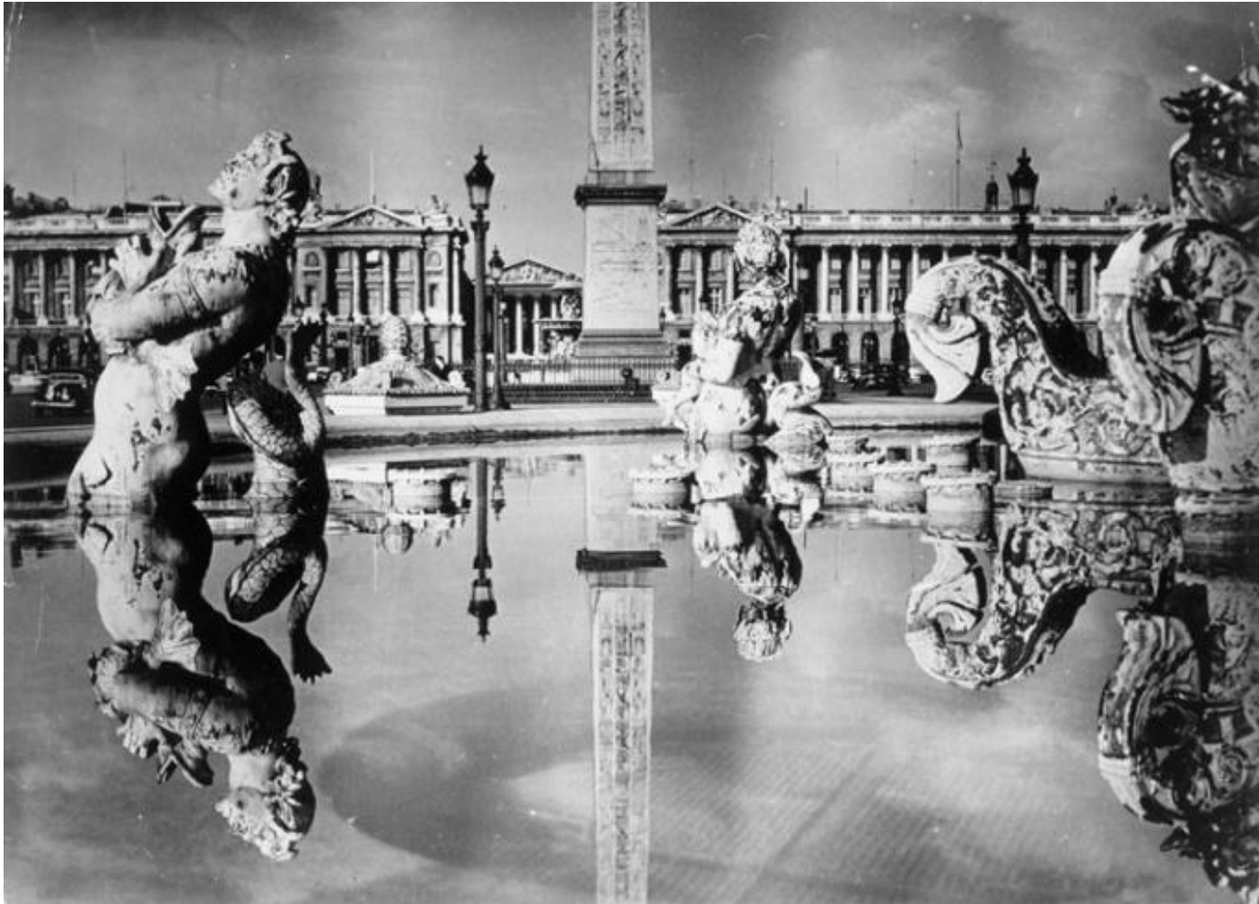
Площадь согласия. 1945