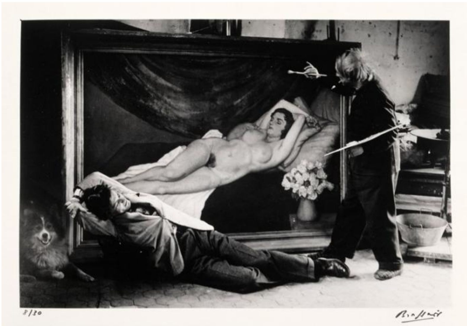
Жан Марэ позирует Пикассо. 1944