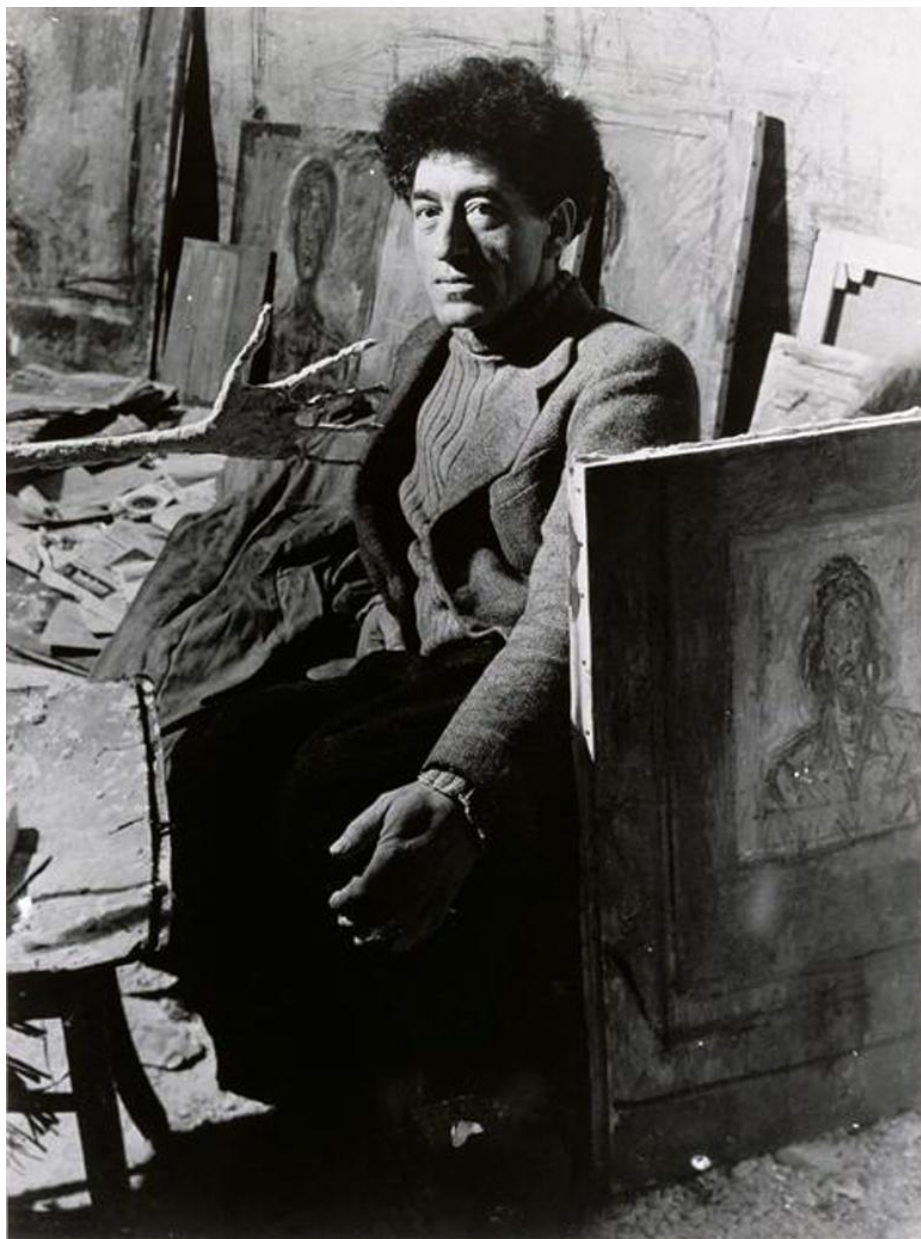
Альберто Джакометти. 1948