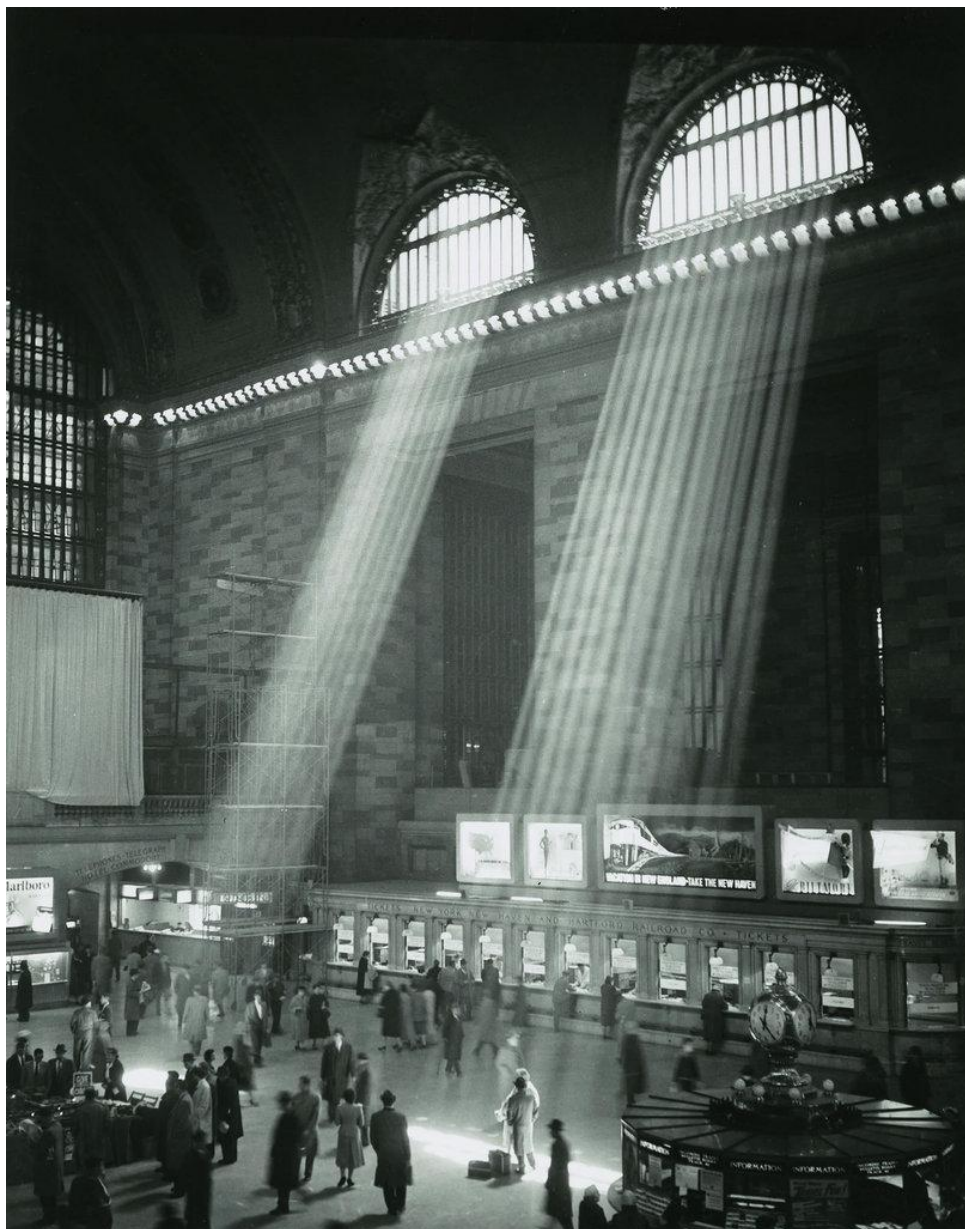
Центральный вокзал. Нью-Йорк. 1957