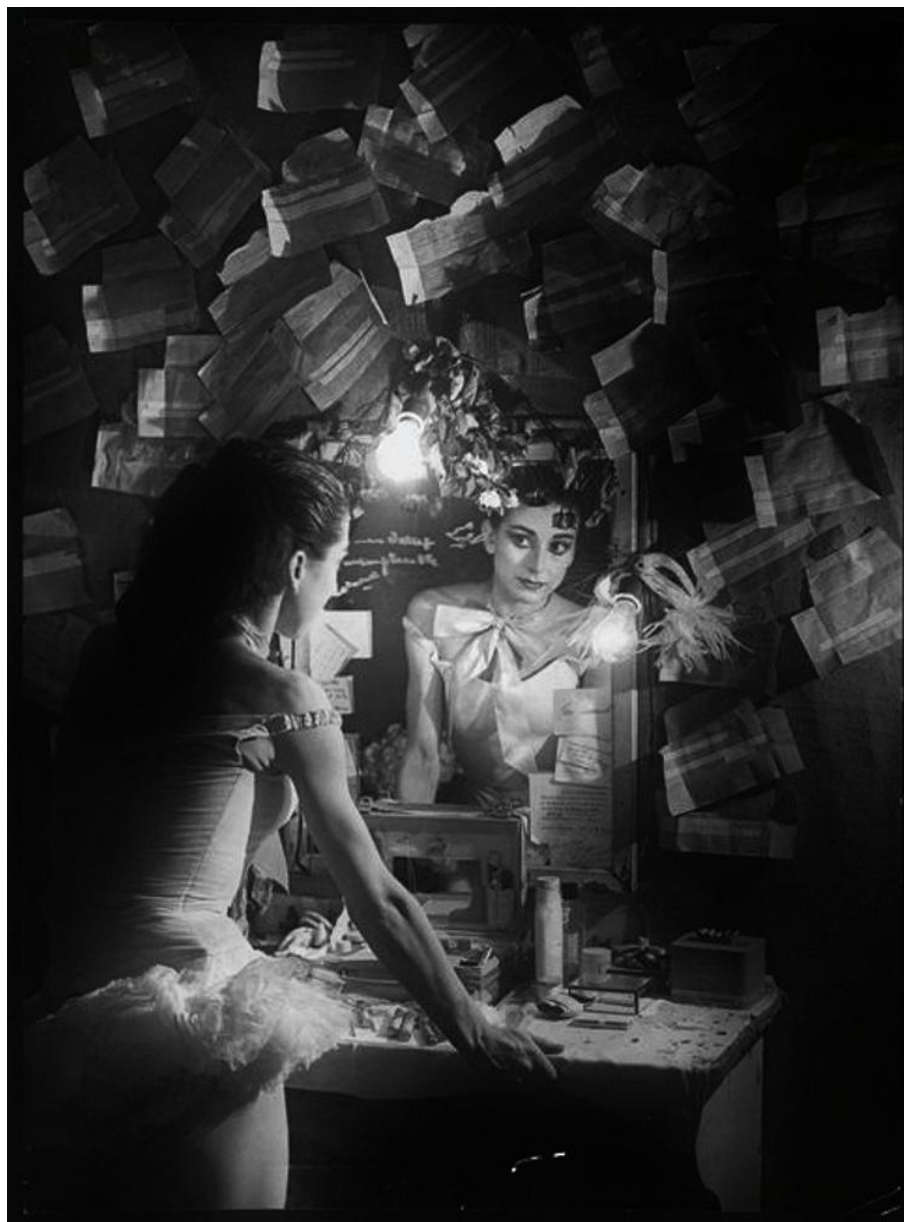
Балерина Марго Фонтейн. 1949