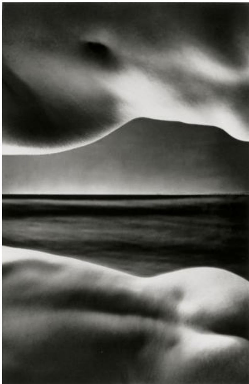
Искусственное небо. 1934