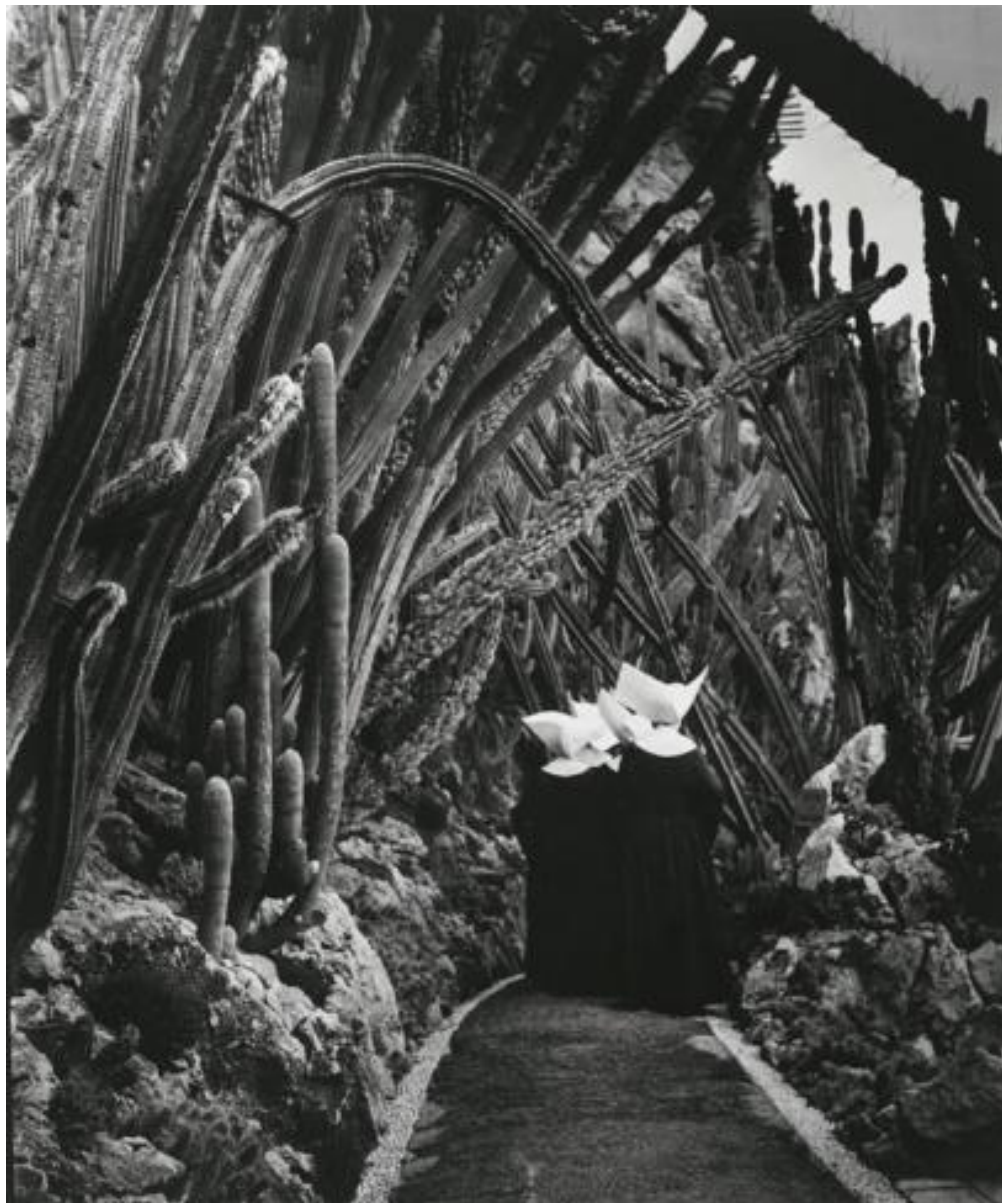
Экзотический сад в Монако. 1945