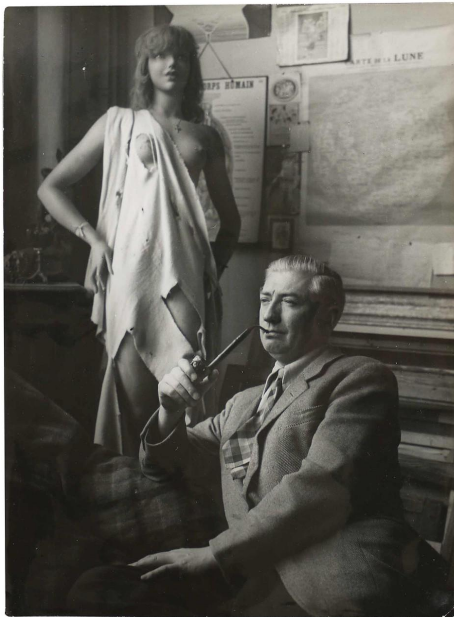
Феликс Лабисс. 1948