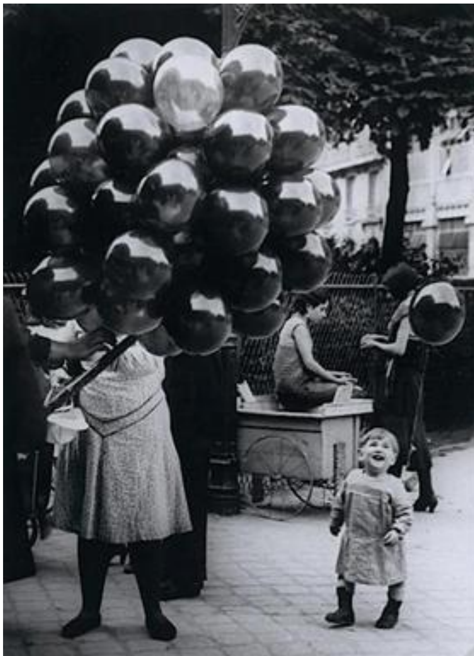
Торговец воздушными шарами. 1931