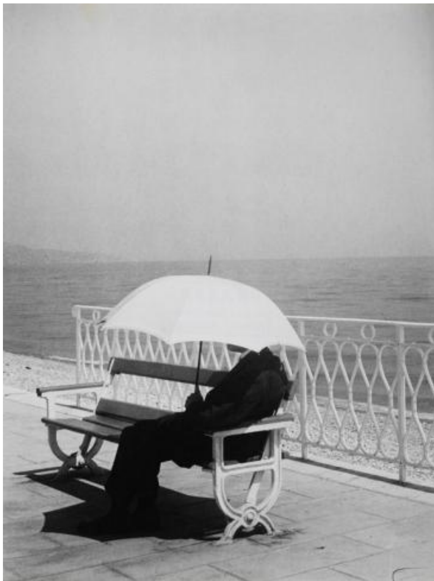
Белый зонтик. 1943