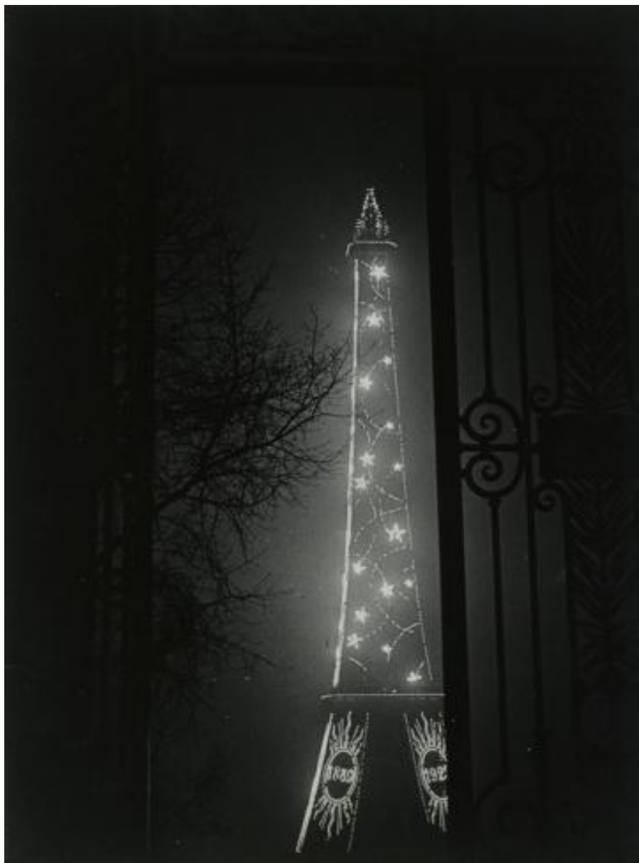
«Эйфелева башня», 1932