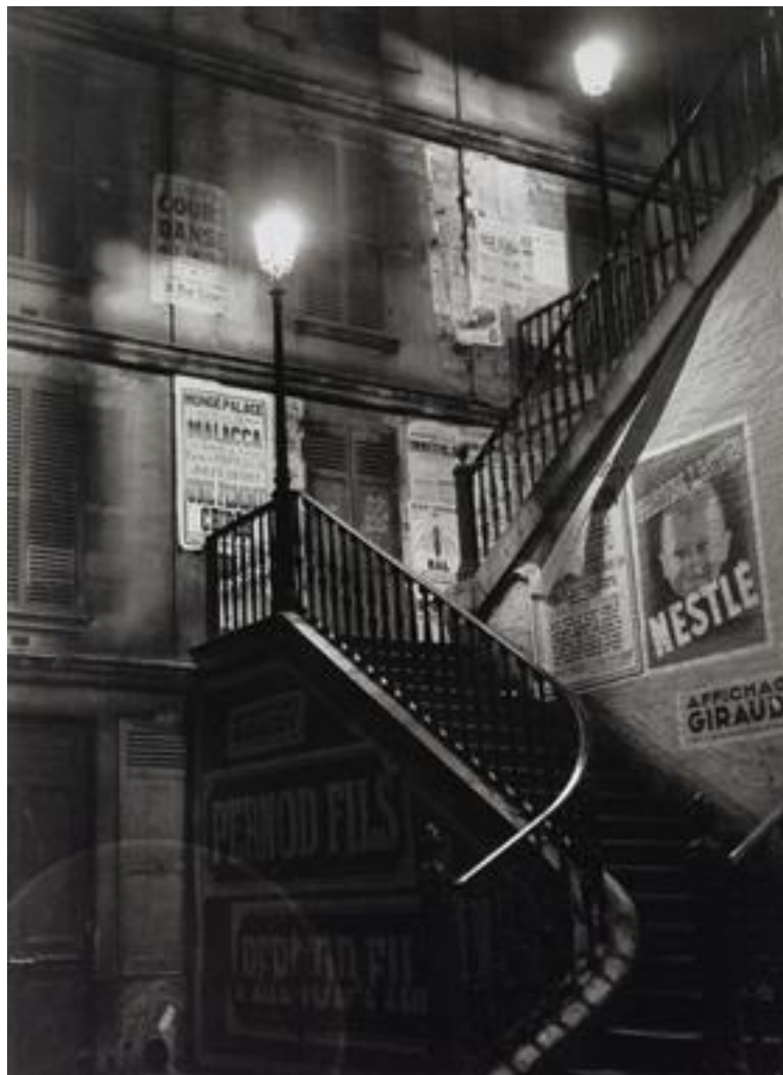
Лестница на улице Роллин. 1934