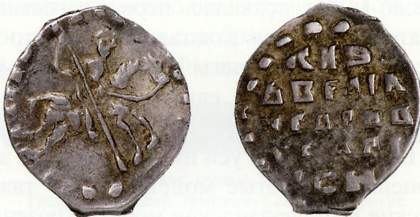
Копейка 1535–1538 гг.