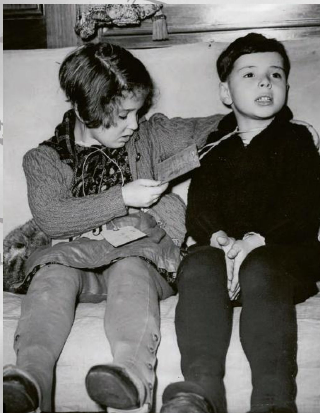
Еврейские дети из Германии, прибывшие в Англию