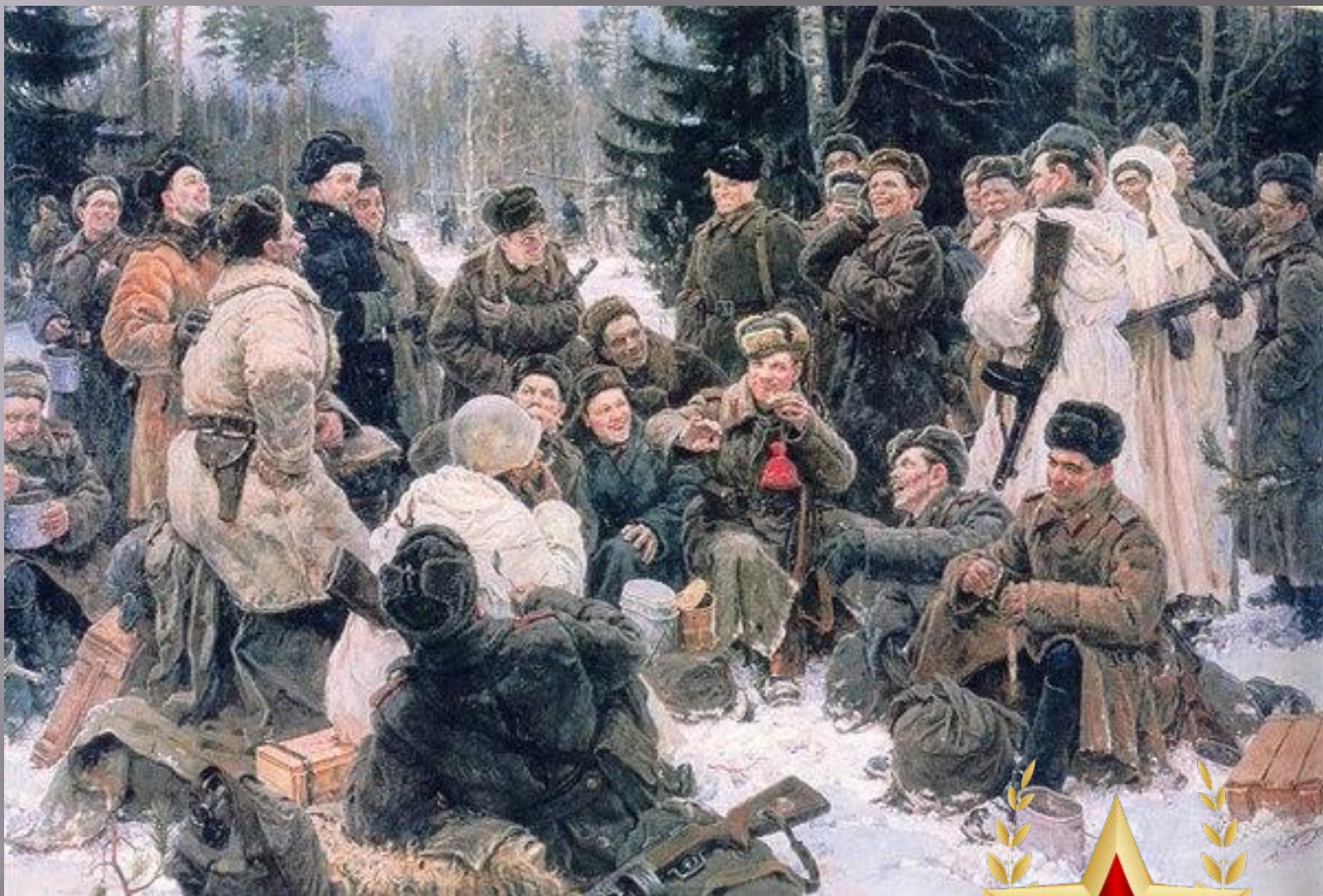
Ю. Непринцев. Отдых после боя.