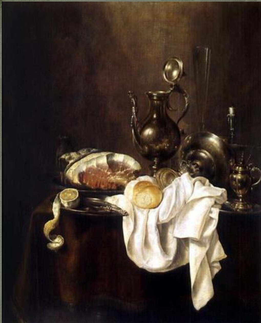
Виллем Клас Хеда (1594-1682) «Натюрморт с ветчиной и серебряной посудой» (1649)