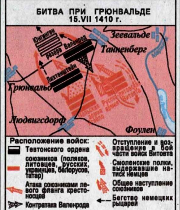
БИТВА ПРИ ГРЮНВАЛЬДЕ 15.VII 1410 г.