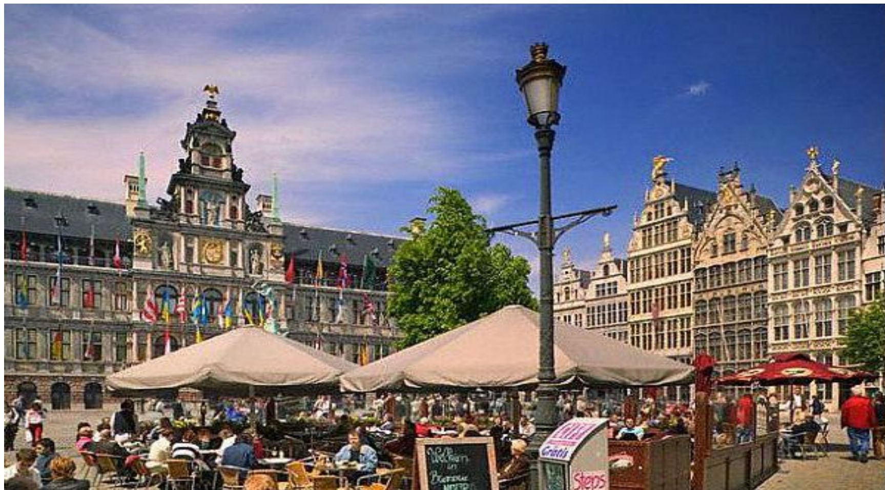
Антверпен- ворота Европы