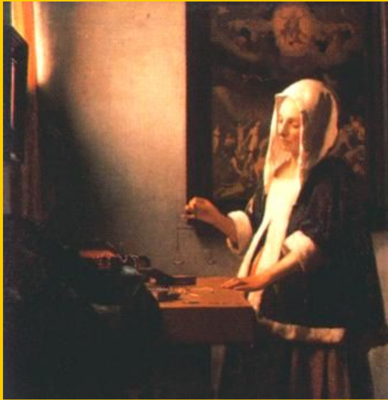
Вермер Делфтский. «Женщина, взвешивающая Жемчуг».

В 16 в. в Европу хлынул поток золота-деньги обесценились. Это привело к росту цен в 4-7 раз.