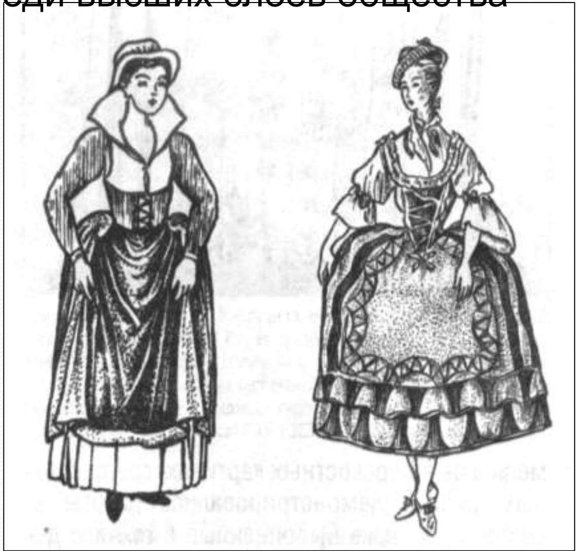
Городской костюм (Германия, XVI в)