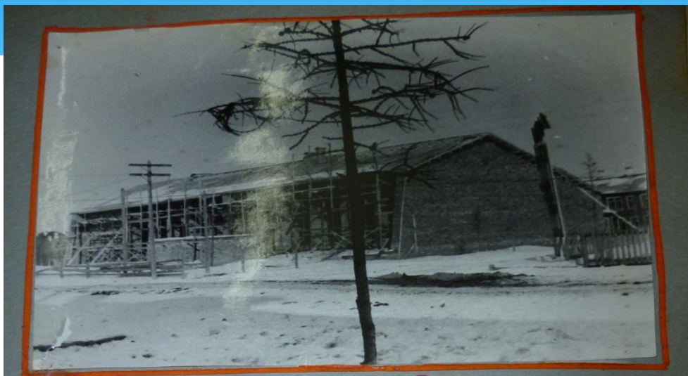
Строительство Дома культуры.