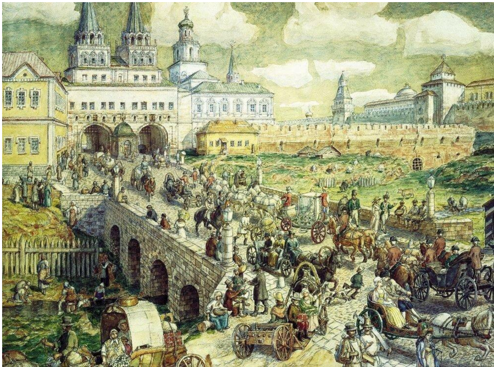
Уличное движение на Воскресенском мосту в XVIII веке. 1926 Бумага, акварель, уголь. 45 x 60 см Музей истории и реконструкции города Москвы