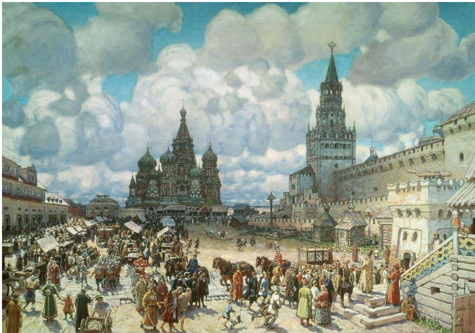
Красная площадь во второй половине XVII века. 1925 Холст, масло. 122 x 177 см Музей истории и реконструкции города Москвы