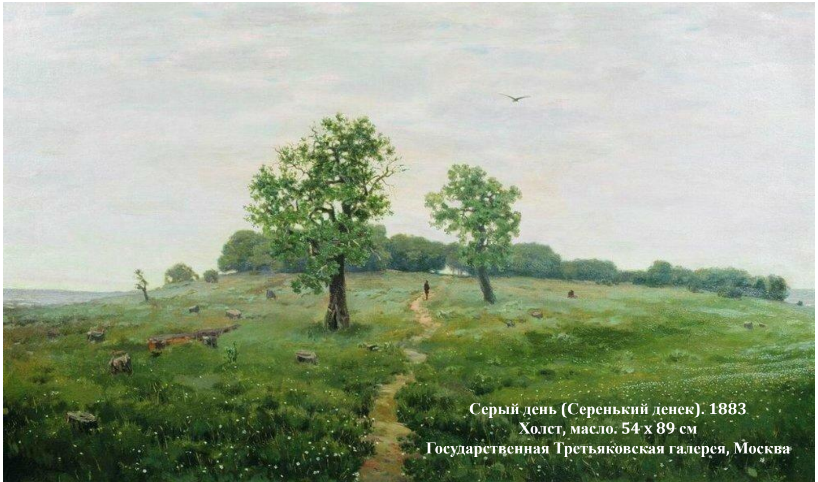
Серый день (Серенький денек). 1883 Холст, масло. 54 x 89 см Государственная Третьяковская галерея, Москва

Молодого художника интересует прежде всего пейзаж. Первым свидетельством преодоления ученического уровня и признания молодого художника стало приобретение Павлом Третьяковым с IX выставки Товарищества передвижных художественных выставок картины «Серенький день» (1883). Мягкая гамма сближенных зеленовато-серых тонов хорошо передает световоздушную среду, глубину пейзажного пространства и состояние пасмурного дождливого дня на берегу Финского залива.