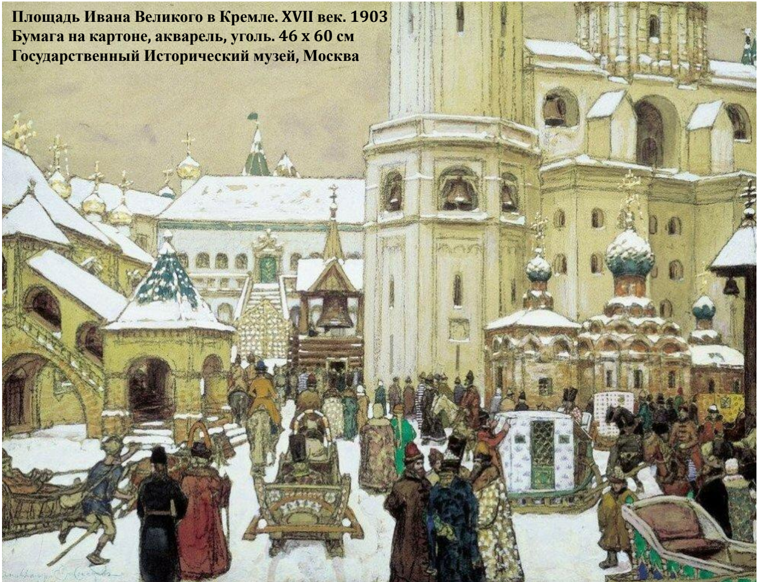
Площадь Ивана Великого в Кремле. XVII век. 1903 Бумага на картоне, акварель, уголь. 46 x 60 см Государственный Исторический музей, Москва

Широк и разнообразен круг его увлечений: в эти годы он создал лучшие свои пейзажи, совершил путешествия в Крым, на Кавказ и по Европе, написал множество этюдов, начал работать в области иллюстрации и театрально-декорационной живописи, приступил к разработке темы старой Москвы.