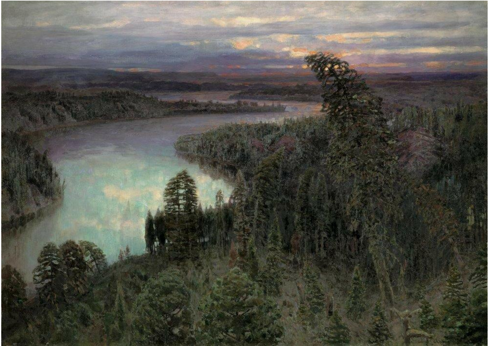
Северный край. 1899