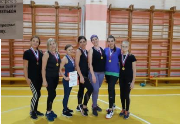
12 января на площадке в Некузской средней школы прошли игры четвертого тура соревнований по мини-футболу.