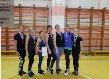
12 января на площадке в Некузской средней школы прошли игры четвертого тура соревнований по мини-футболу.