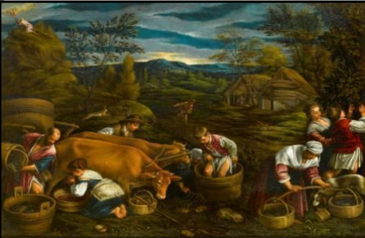
Франческо Бассано Осень, 1576