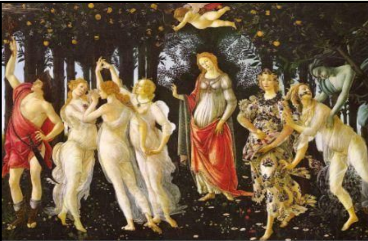
Сандро Боттичелли Весна, 1477 - 1478, Уффици, Флоренция