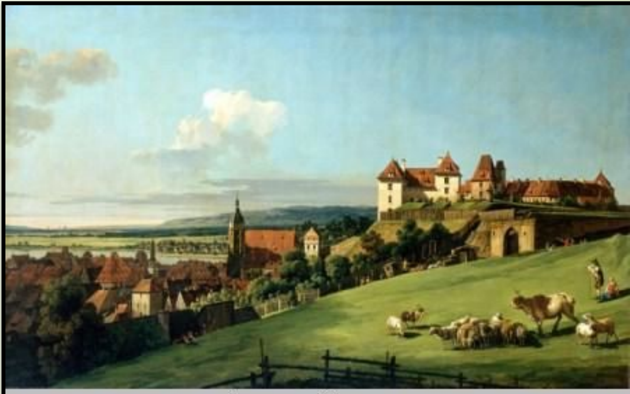
Бернардо Беллотто Вид на г. Пирна с замка Зонненштайн, ~1750