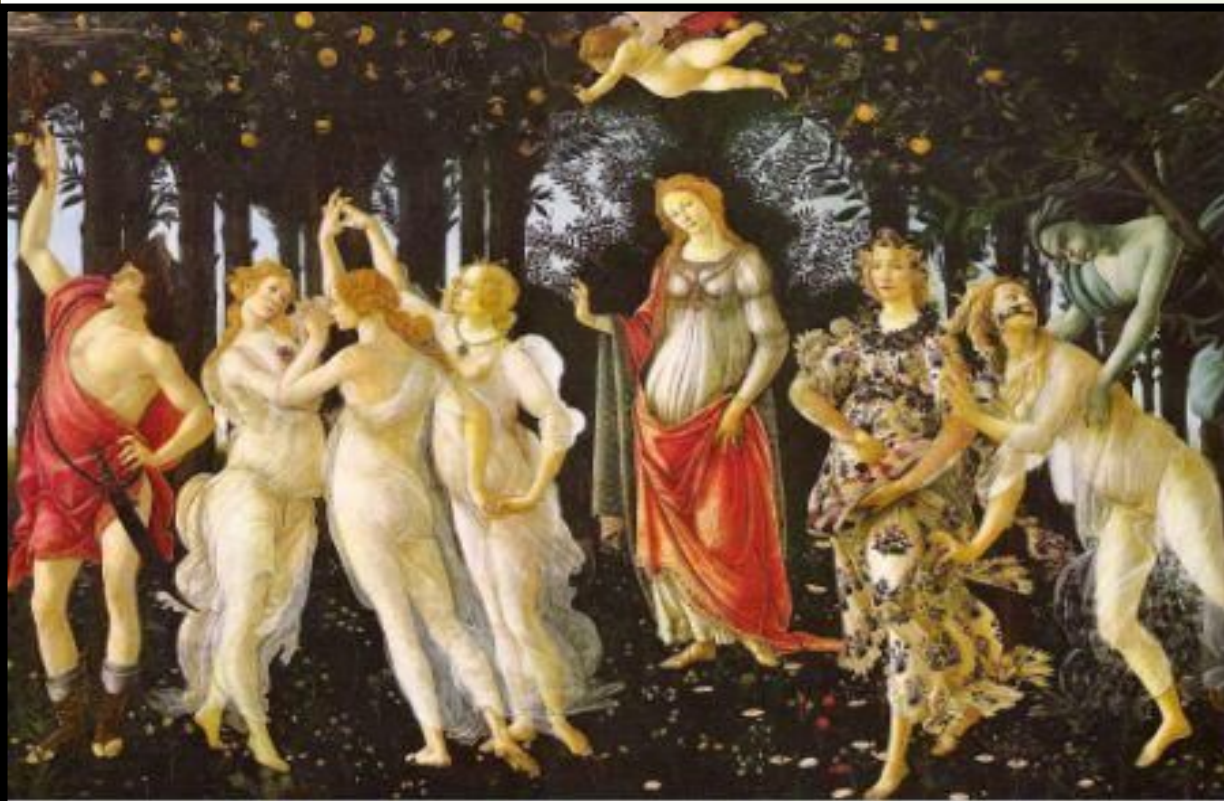
Сандро Боттичелли Весна, 1477 - 1478, Уффици, Флоренция