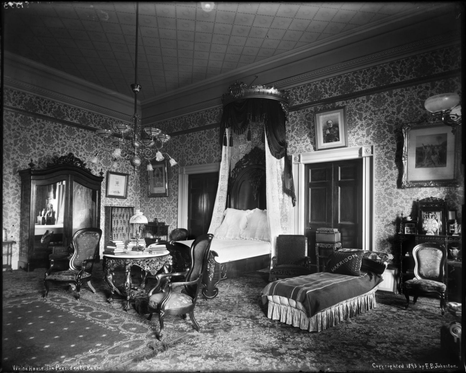
White House The President's Room.