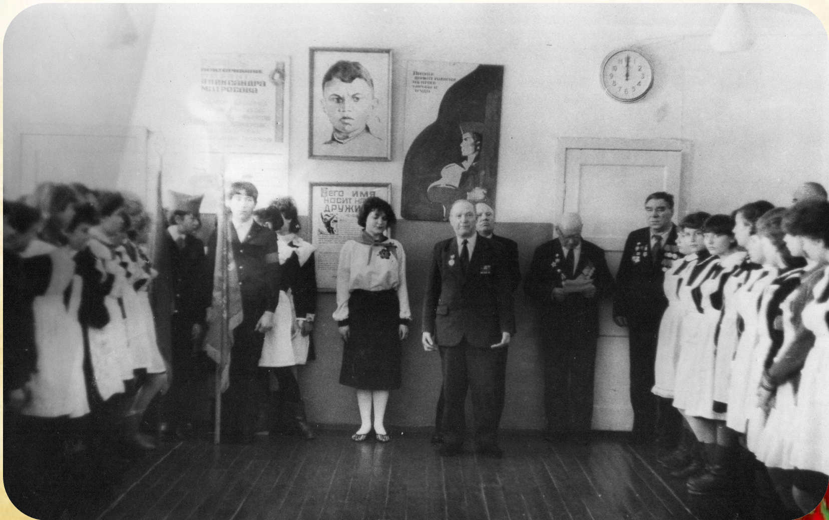
Торжественный сбор пионерской дружины