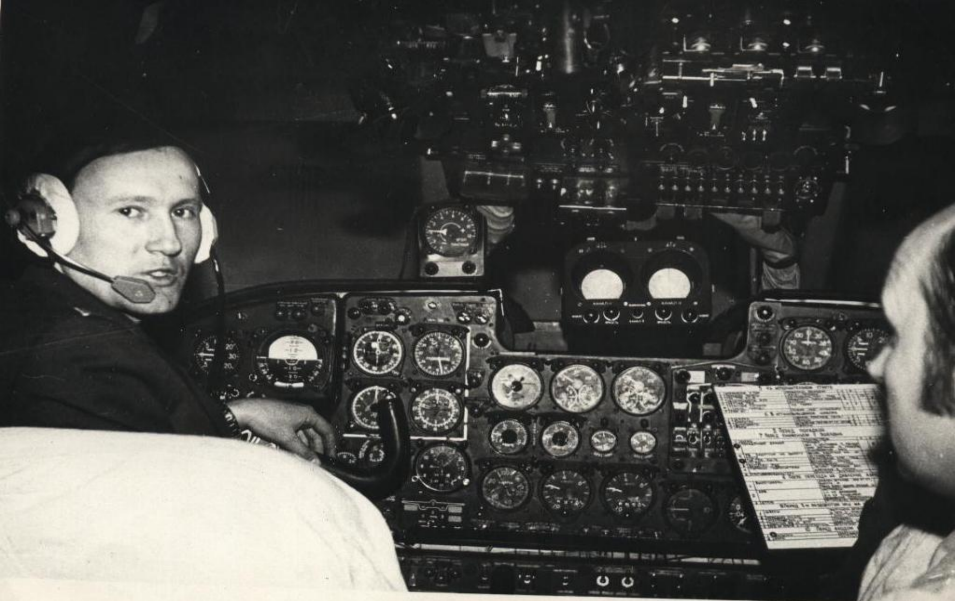
На тренажёре самолёта Ан-24 Иркутск