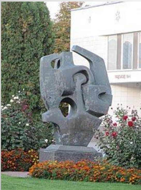
Скульптура «Сердце губернии», ул. Московская, Саратов, 2000г.