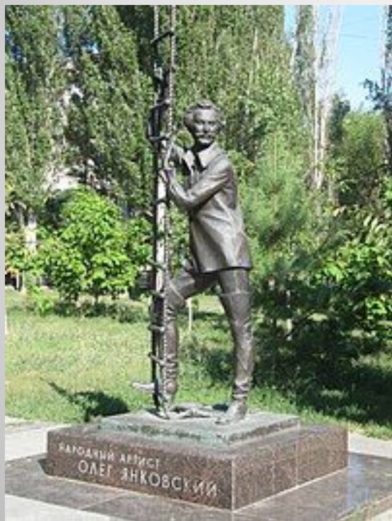
Памятник О. И. Янковскому в сквере перед Саратовским театром драмы им. И. А. Слонова, Саратов, 2016 г.