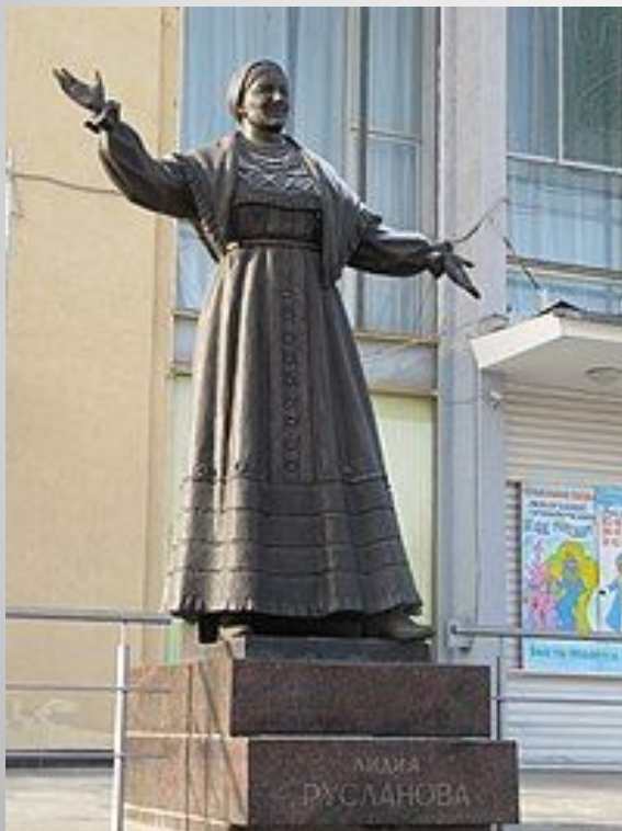
Памятник Л. А. Руслановой, Саратов, 2018г.