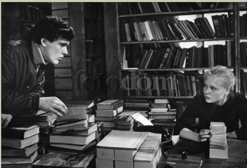
FB14-1528 Кадр из фильма "У озера", СССР, 1969. На фото - Николай Еренко-младший и Наталья Белохвостикова.