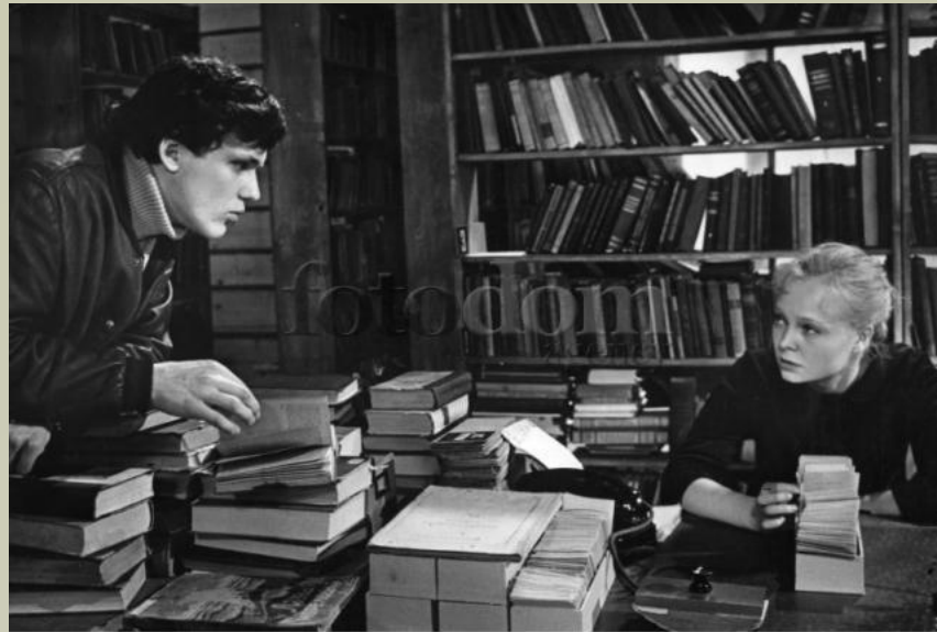
FB14-1528 Кадр из фильма "У озера", СССР, 1969. На фото - Николай Еренко-младший и Наталья Белохвостикова.