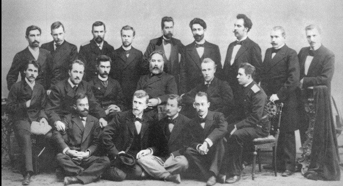
А.И. Куинджи с учениками, фото 1897 г.