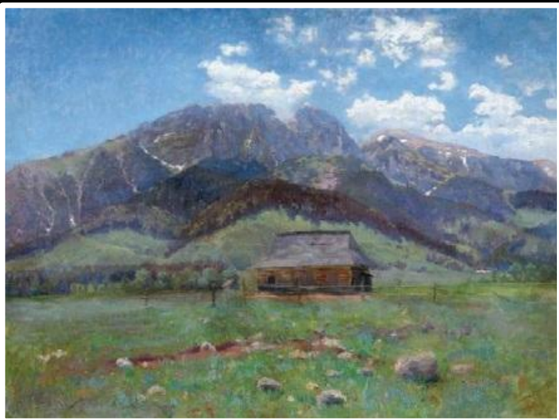
К.Х. Врублевский «В Карпатах». 1896 г