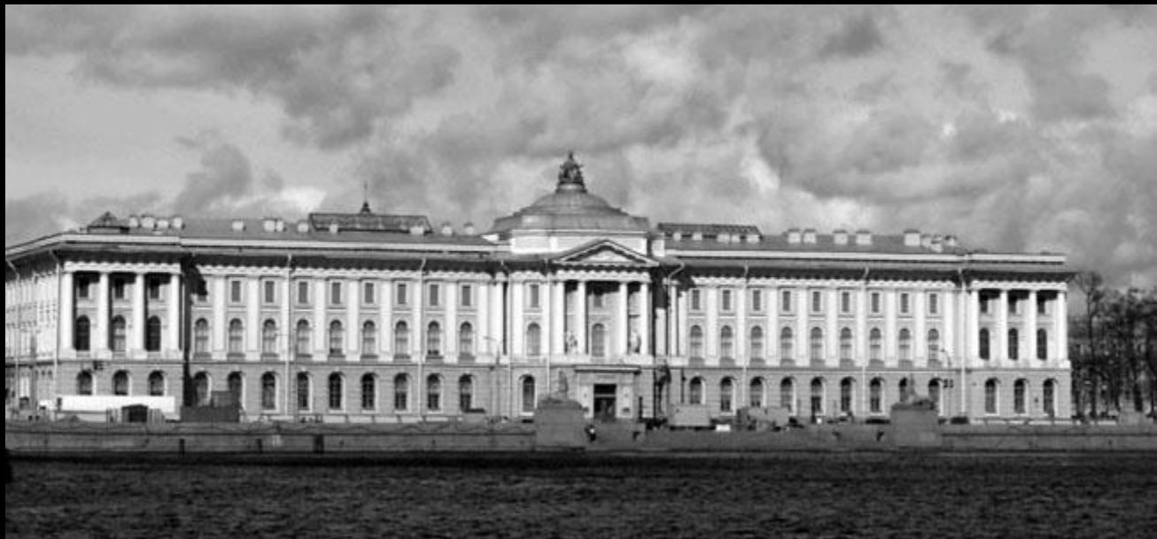
Императорская Академия художеств