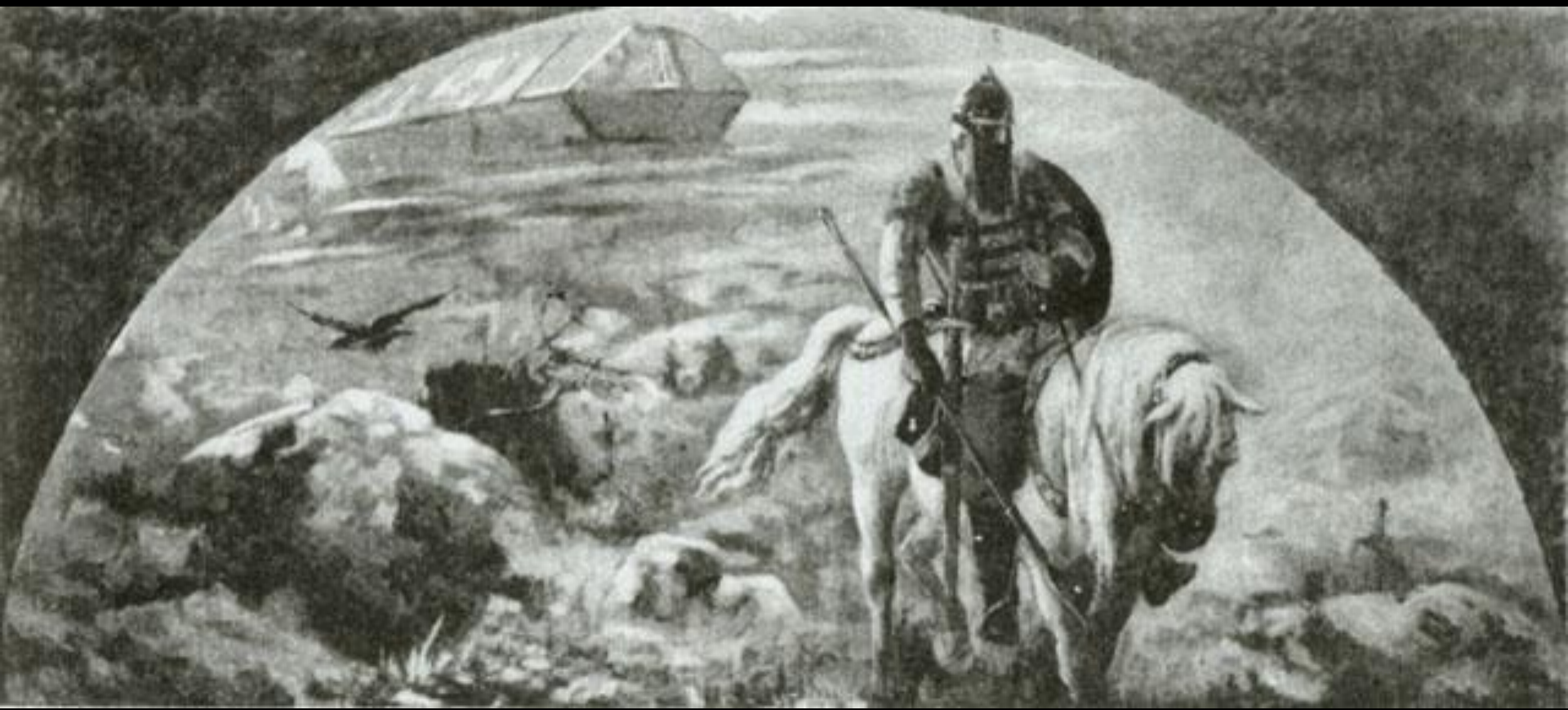
Н. Рерих. Утро Богатырства Киевского (эскиз фрески). 1896 г.