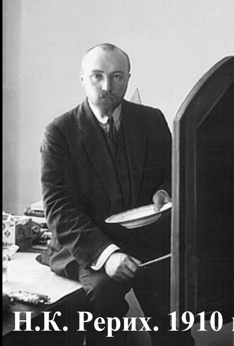
Н.К. Рерих. 1910 г.