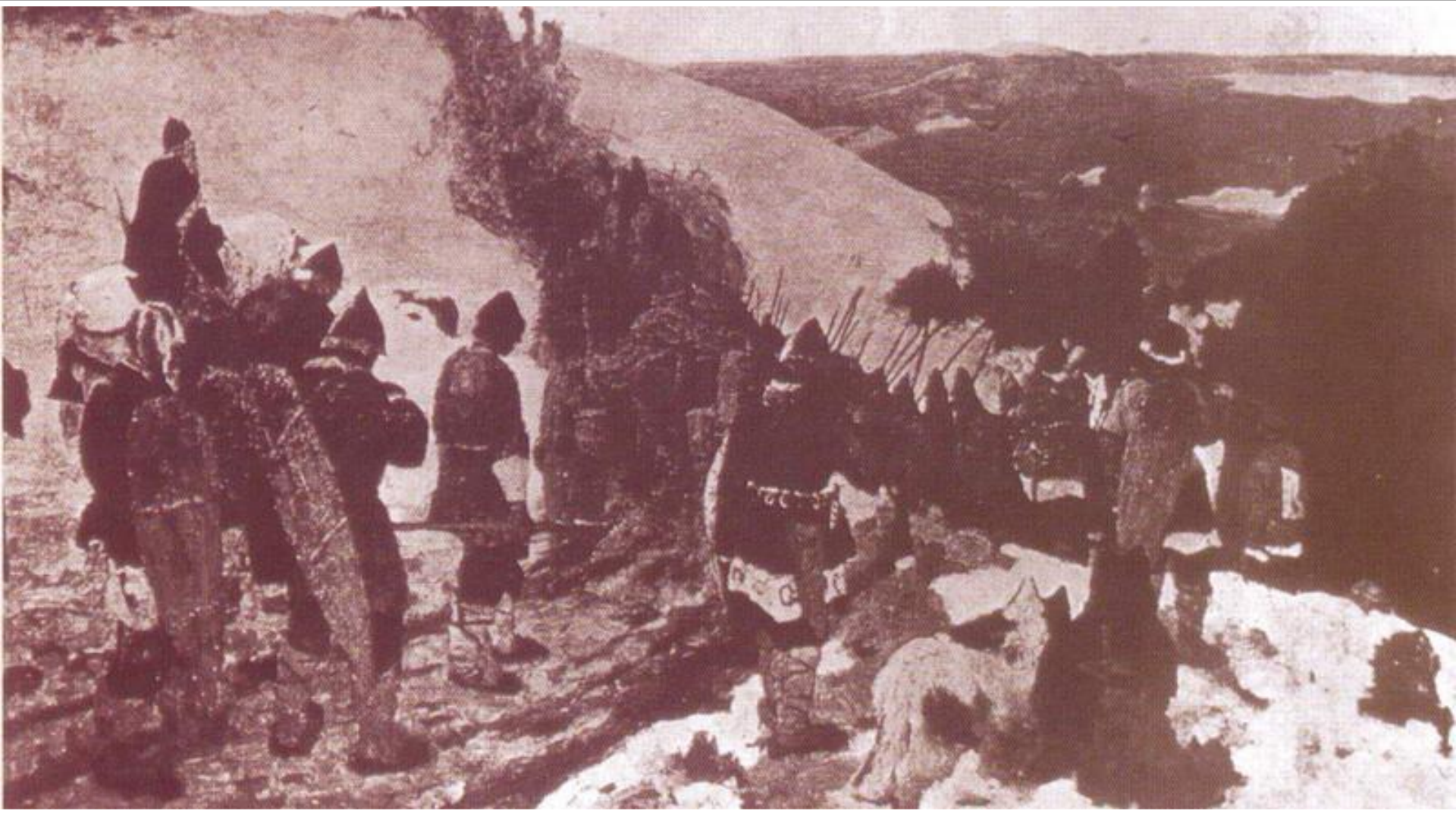
Н. Рерих. «Поход» 1899 г