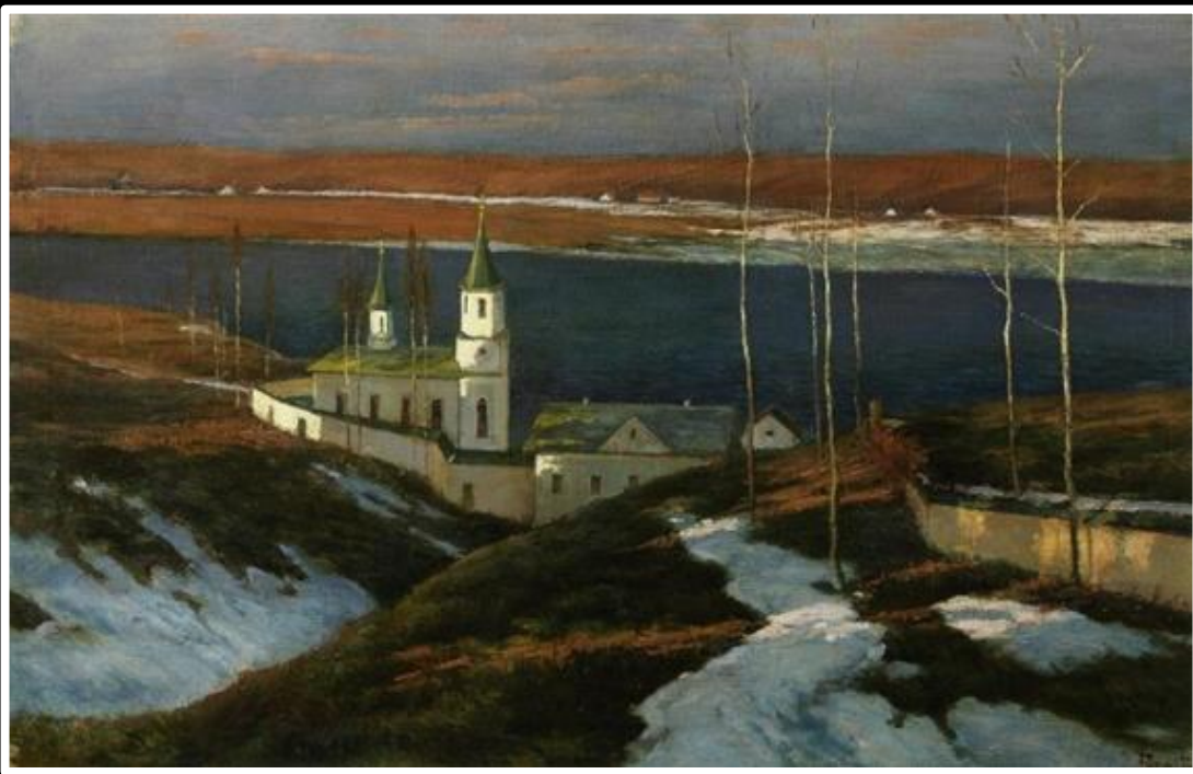
В. Пурвит. «При последних лучах»