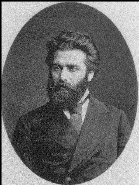
А.И. Куинджи, фото 1890-е