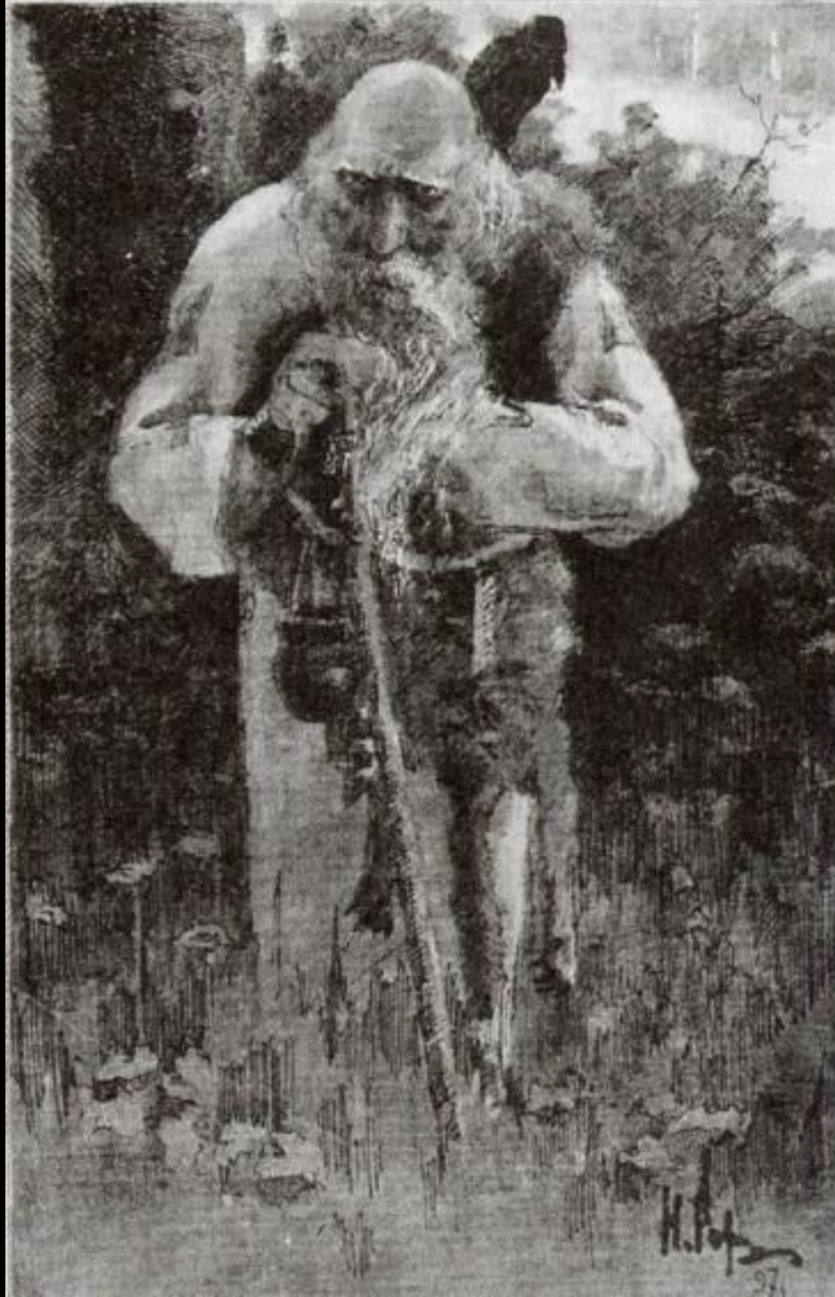
Н. Рерих. «Ведун» (эскиз). 1897 г