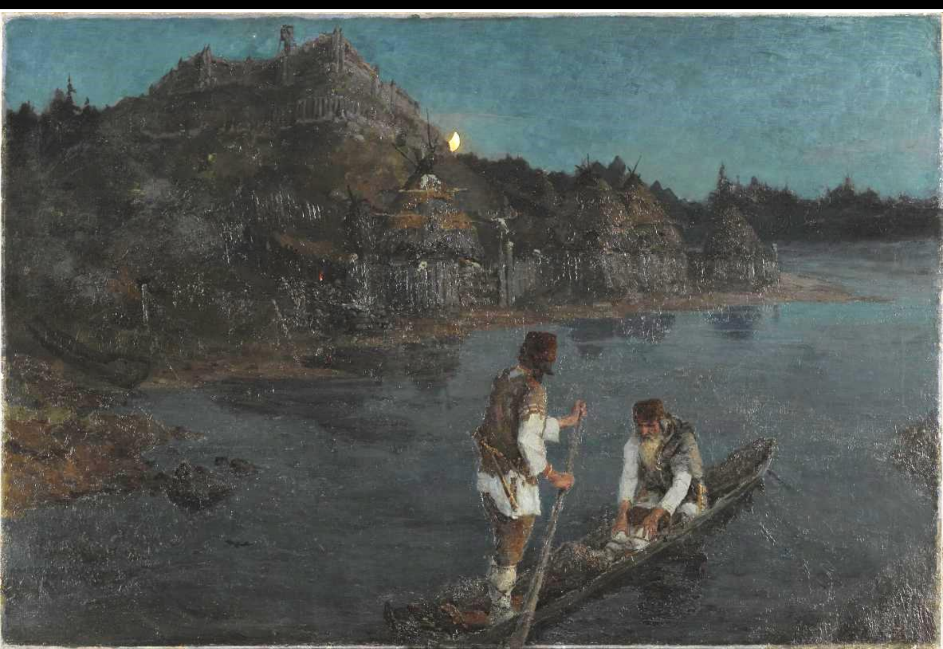
Н. Рерих. Гонец. Восстал род на род. 1897 г.