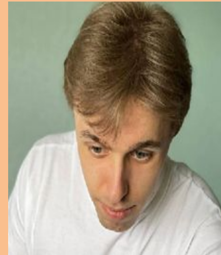
Маркетинг и связи с общественностью