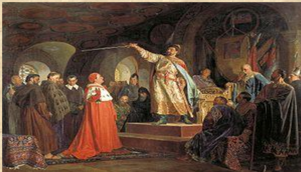
Князь Роман Галицький не приймає королівської корони. Мал. Неврева. 1899 р.

«Цього в папи вашого немає, а поки це при мені — не треба мені ніякого королівства. Батьки й діди мої здобували собі землі і городи мечем, — здобуду і я; як був князем, так і буду, а ламати свою віру задля королівської корони не стану!».