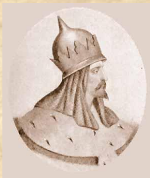
Мстислав Ізяславович 1154 – 1170