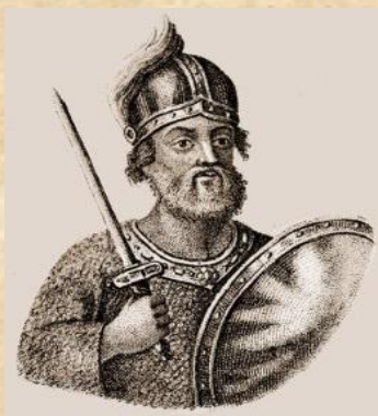
Ізяслав II Мстиславович 1136 – 1154

Волинь довгий час управлялася з Києва, не маючи власної династії. У XII ст. була закріплена за династією Ізяславичів ( Ізяслав II – онук Володимира Мономаха ).