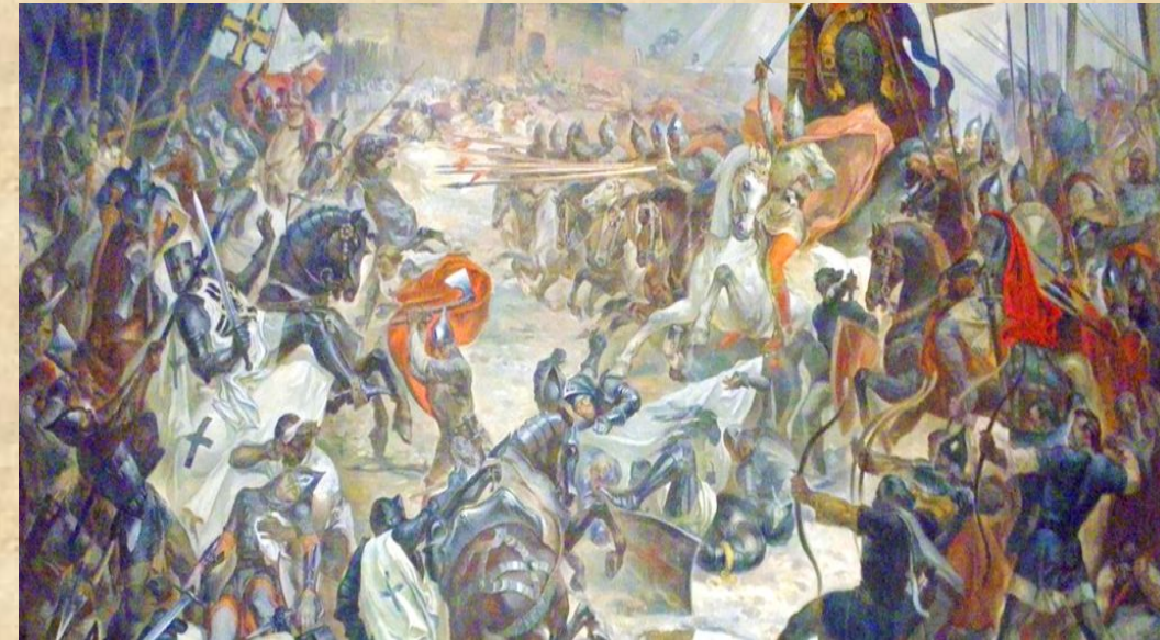
Битва під Дорогичином. Худ. С. Серветник

1238 р. Данило розгромив тевтонських лицарів Добжинського ордену біля м. Дорогочин;