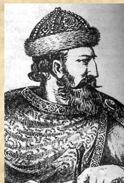
Роман Мстиславович 1170 – 1199