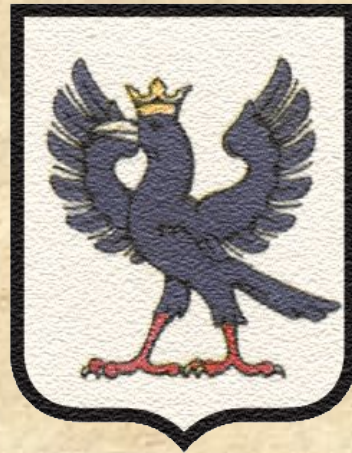
Герб м. Галич