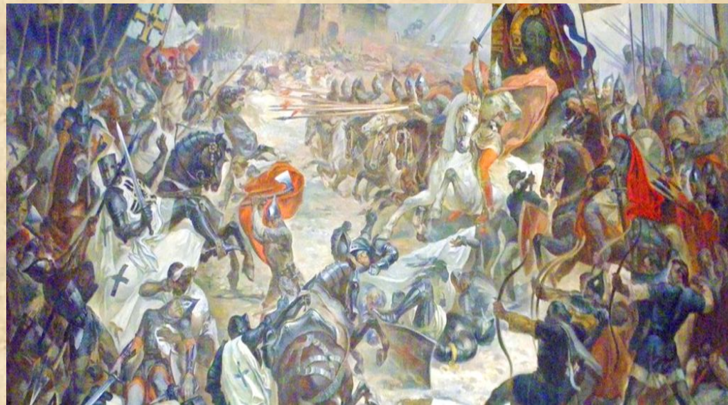
Битва під Дорогичином. Худ. С. Серветник

1238 р. Данило розгромив тевтонських лицарів Добжинського ордену біля м. Дорогочин;