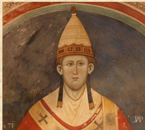
Папа Римський Інокентій III