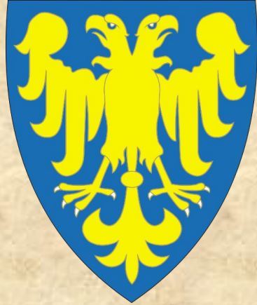
Герб Романа Великого