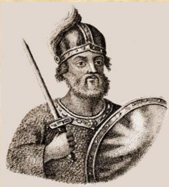
Ізяслав II Мстиславович 1136 – 1154

Волинь довгий час управлялася з Києва, не маючи власної династії. У XII ст. була закріплена за династією Ізяславичів ( Ізяслав II – онук Володимира Мономаха ).