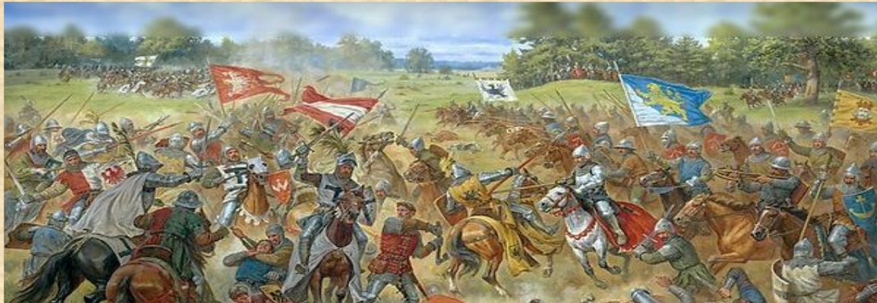
Битва біля м. Завихвост

У червні 1205 р. гине в облозі м. Завихвоста на р. Вісла – від вояків