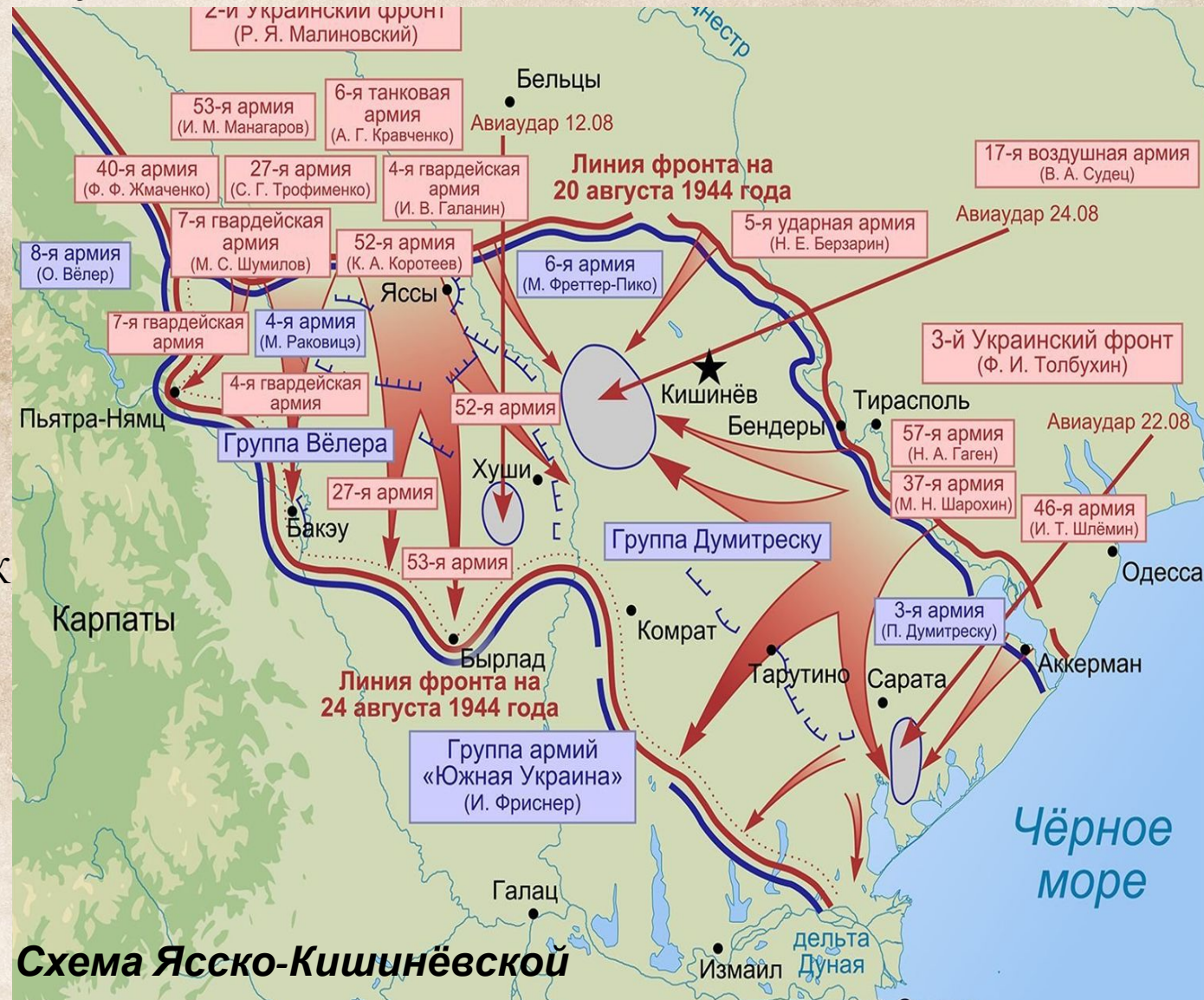
Схема Ясско-Кишинёвской операции

Наступление советских войск на внешнем фронте всё более нарастало. Соединения Третьего Украинского фронта, наступая на юг по обоим берегам Дуная, отрезали пути отхода разбитым немецким войскам к Бухаресту. Черноморский флот и Дунайская военная флотилия содействовали наступлению войск, высаживали десанты, наносили удары морской авиацией. 29 августа морской десант Черноморского флота занял порт и главную военноморскую базу Румынии Констанца. На этом Ясско-Кишинёвская операция завершилась.