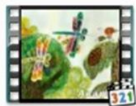
Песенка Винни Пуха на разных языках