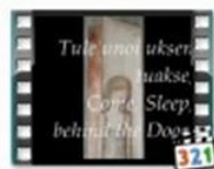
Karjalainen Kehtolaulu - Värttinä ( First Album 1987)