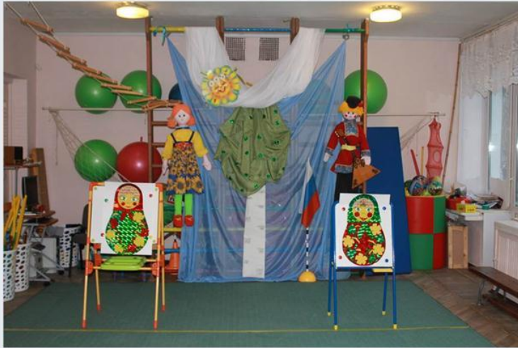
Физкультурный досуг «Моя Россия» в нашей группе