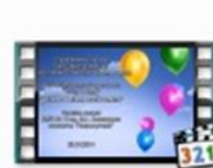
Танцы в кругу - Финская полька