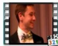
Танец «Финская полька»