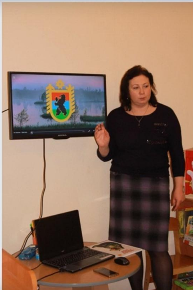
Знакомство с Карелией