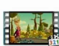
Светофор - Лукоморье Пикчерз