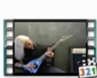
САМПО КАЛЕВАЛА карело-финский эпос