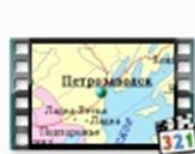
Республика Карелия мульт