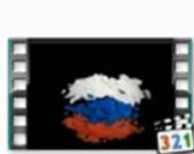
Про барана и козла(карельский мультфильм)