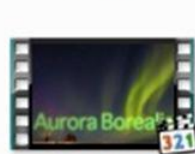
Северное Сияние (Aurora Borealis)