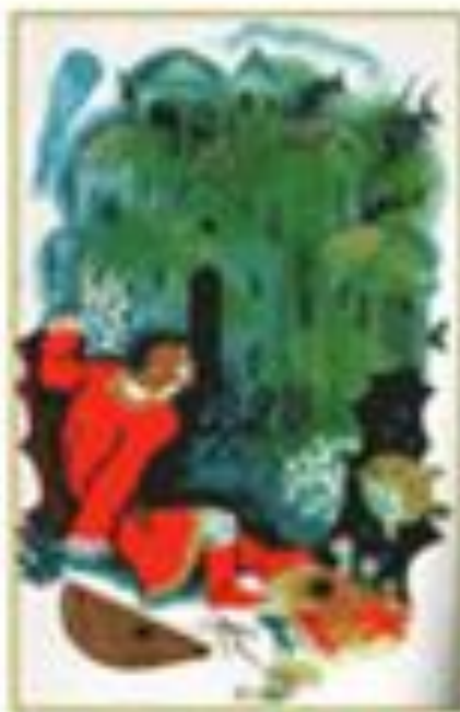
«Садко» сказка - былина