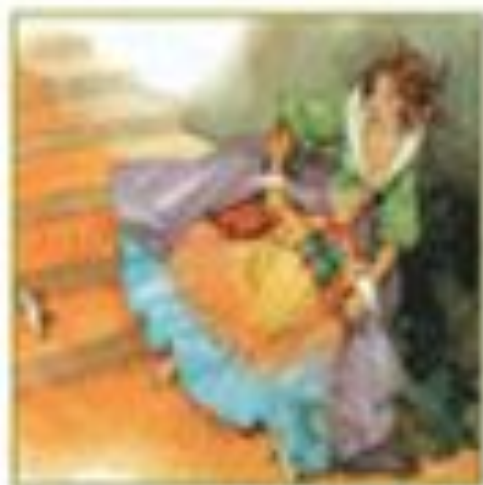
«Золушка» Ш. Перро