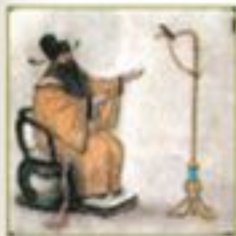
«Соловей» Г.Х. Андерсен