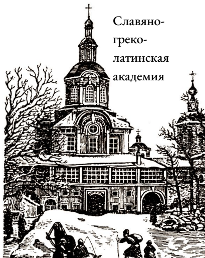
Славяно- греко- латинская академия