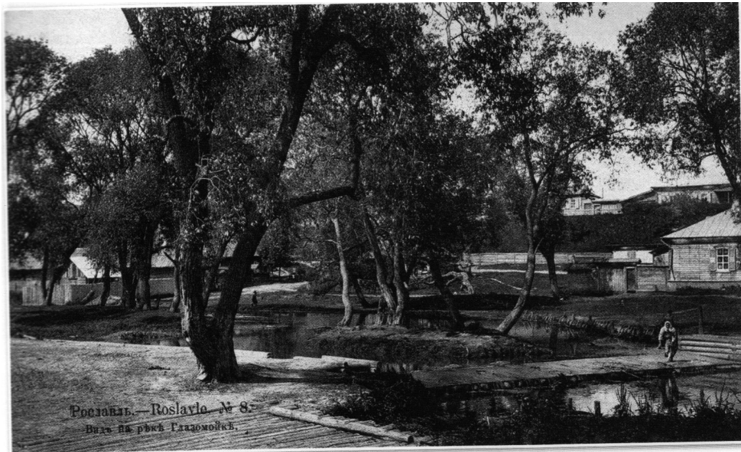
Рославль. Вид на реку Глазмойку. Издание контрагентства А.С. Суворина и К°. Фототипия Шерер, Набгольц и К°. Москва. Начало XX века