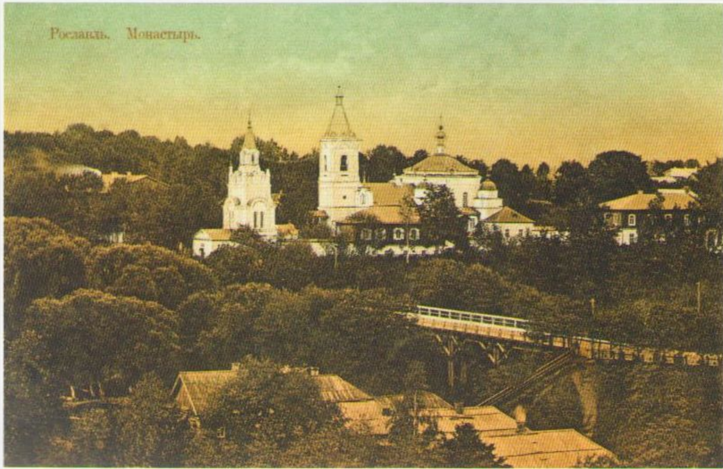
Рославль. Спасо-Преображенский мужской монастырь. Издание С.П. Егорова. Начало XX века