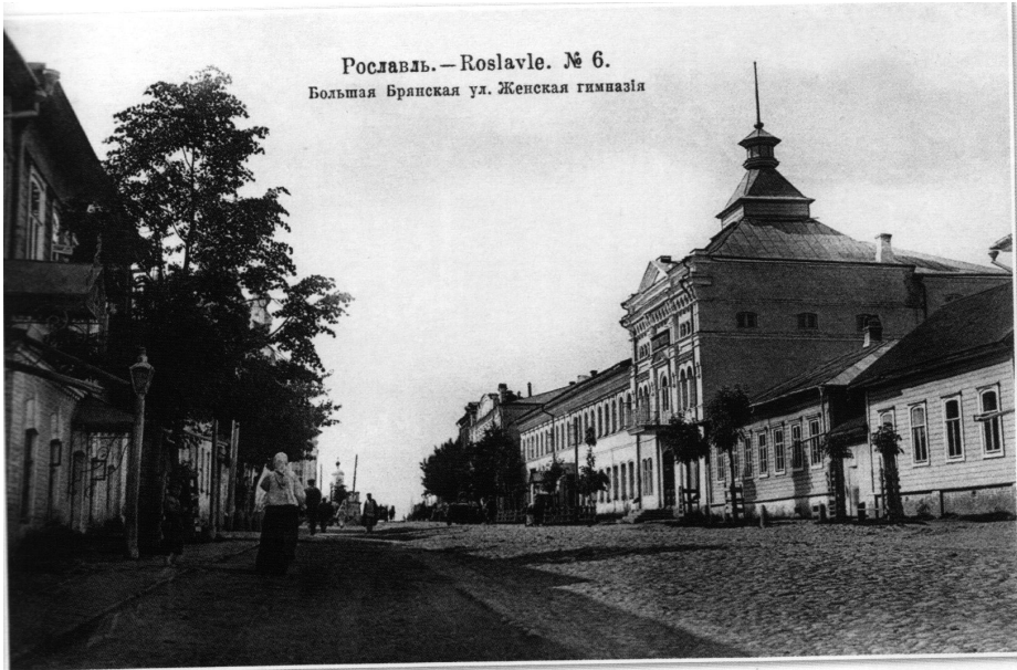
Рославль. — Roslavle. № 6. Большая Бранская ул. Женская гимназия