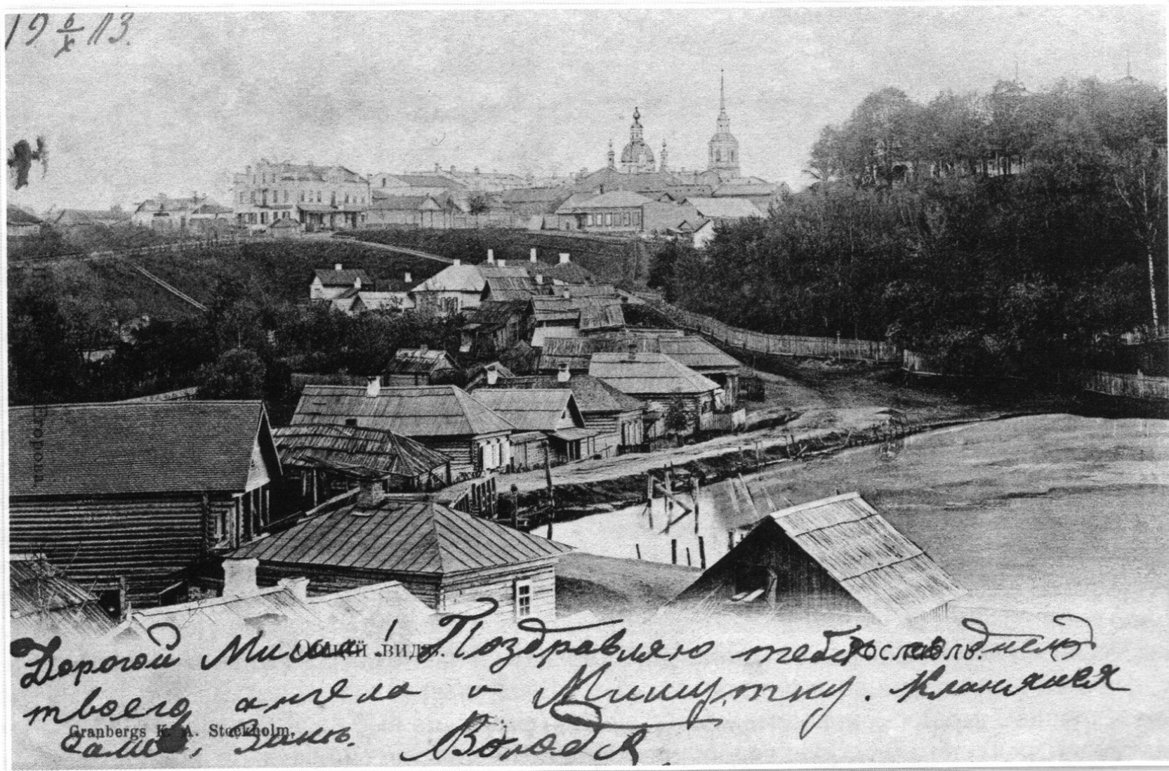
Рославль. Общий вид. Granbergs K.A. Stockholm. Начало XX века