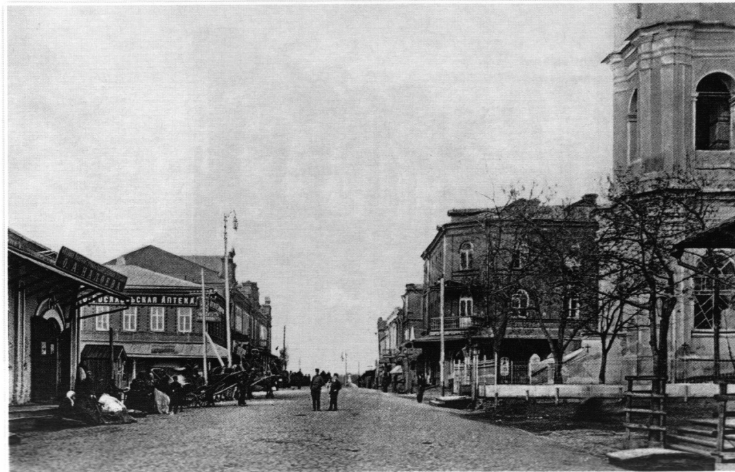
Рославль. Центр города. Перекресток Большой Московской и Большой Брянской улиц. Справа – колокольня Богоявленского собора. Издание С.П. Егорова. Начало XX века