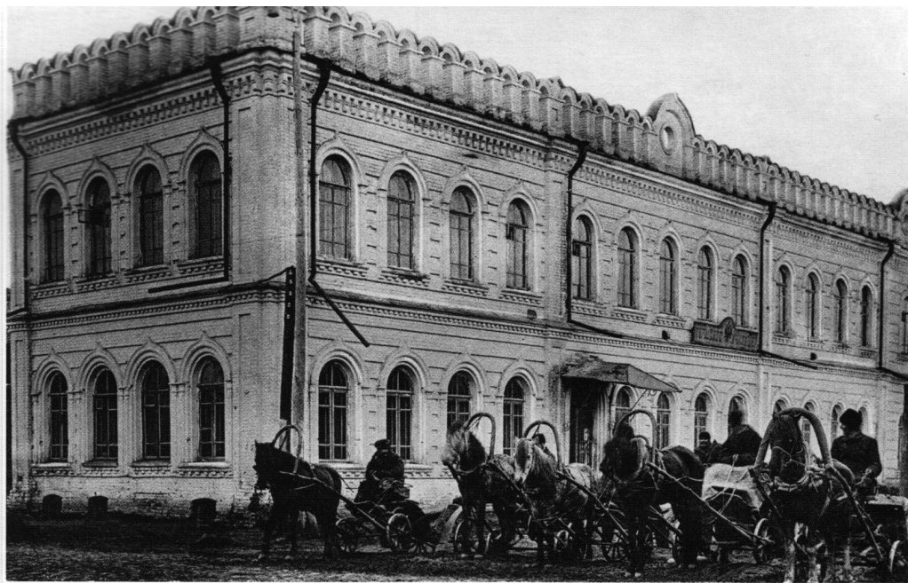
Рославль. Городское училище. Издание С.П. Егорова. Начало XX века