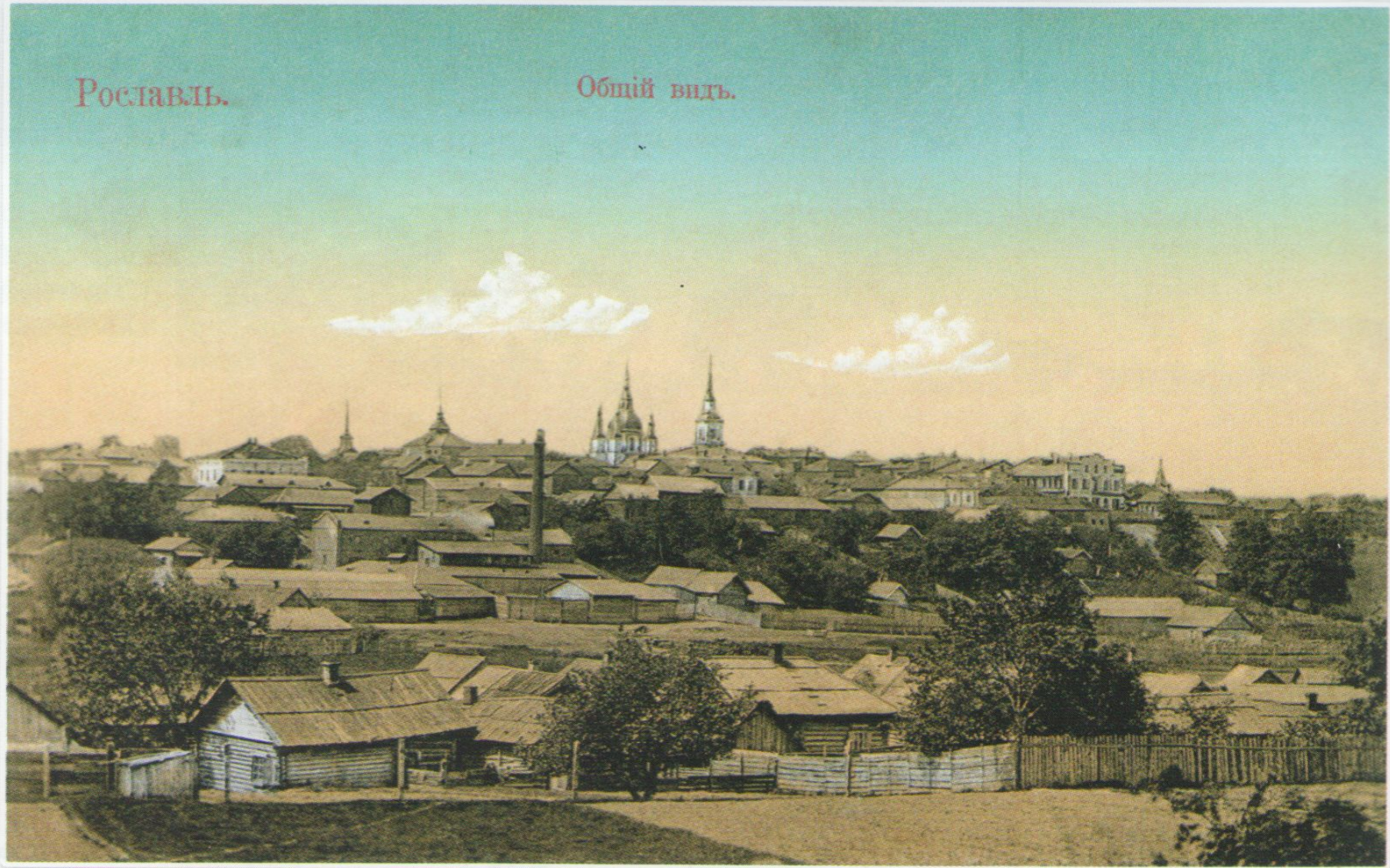
Рославль. Общий вид. Издание С.П. Егорова. Начало XX века