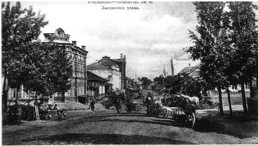
Рославль. Ландинская улица. Издание контрагентства А.С. Суворина и К°. Фототипия Шерер, Набгольц и К°. Москва. Начало XX века