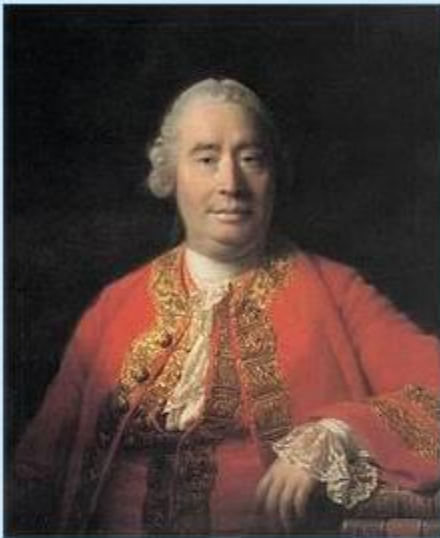
Дэвид Юм (1711-1776) – английский философ

Философское течение, которое отрицает познаваемость объективного мира