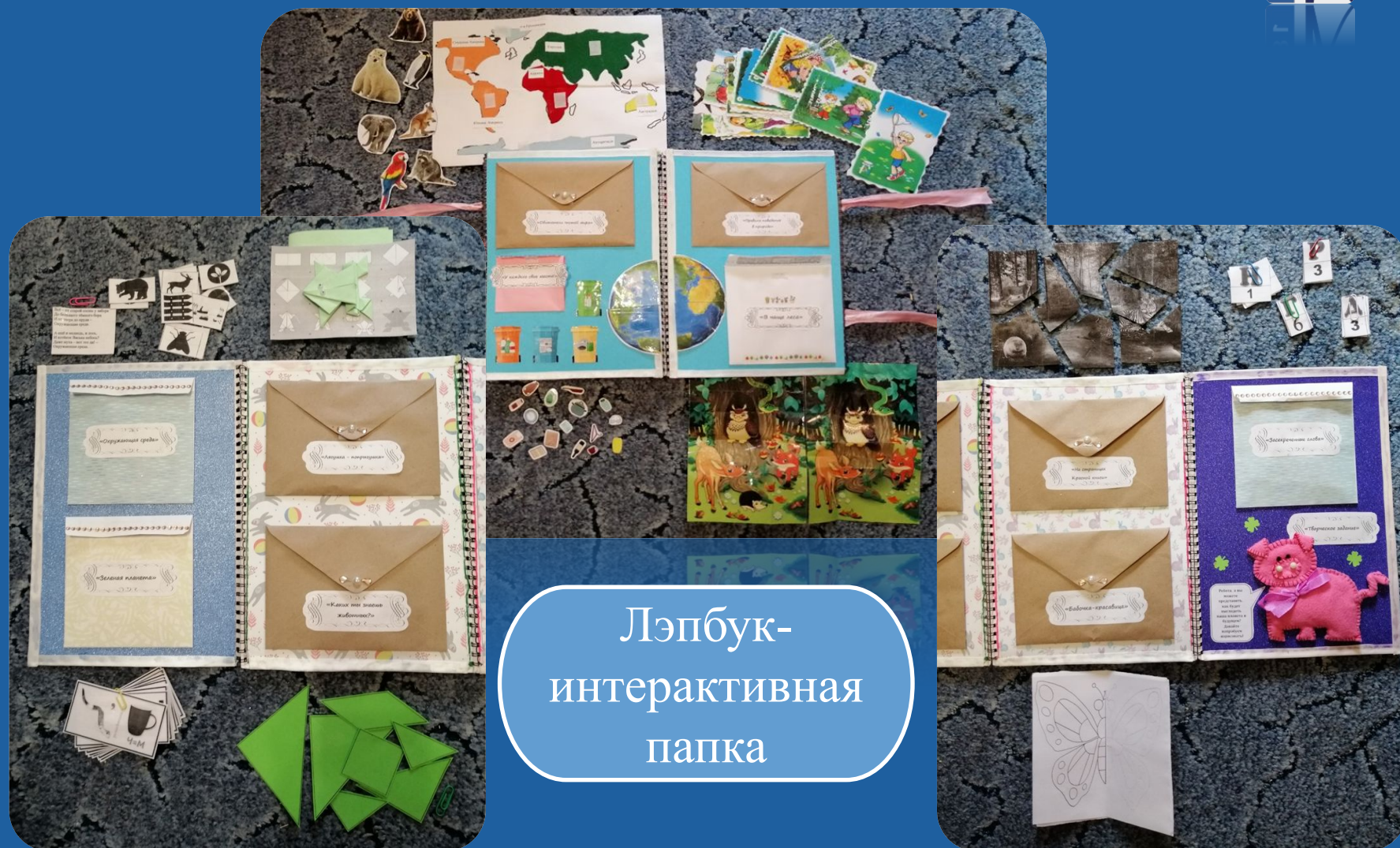
Лэпбук- интерактивная папка