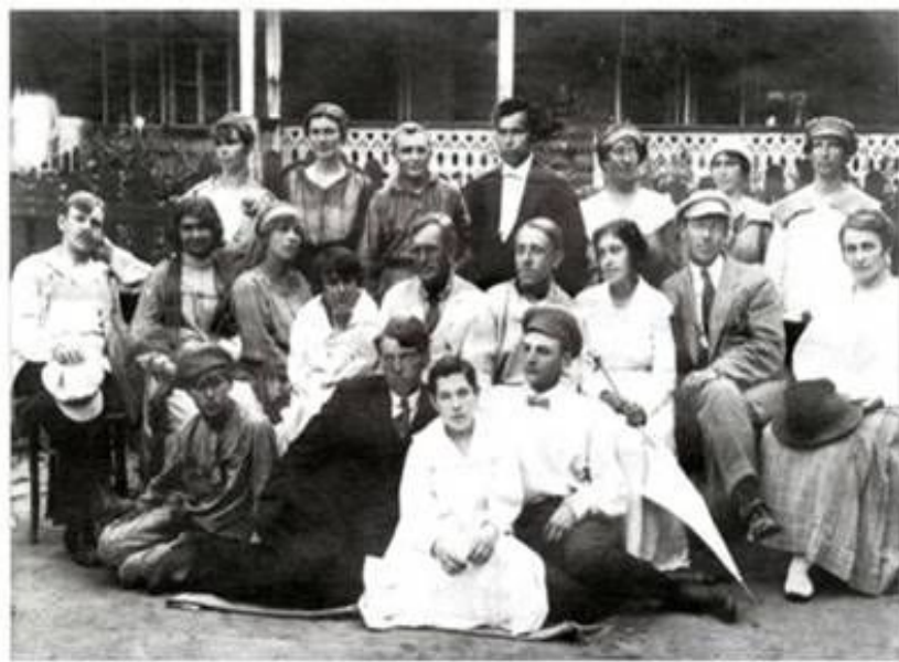
Группа артистов в первые годы работы