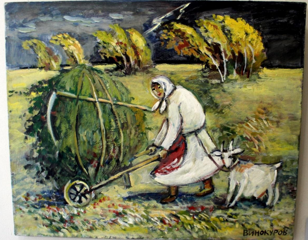
Винокуров В.С. 1949 Гроза 2014 масло, холст Victor S. Vinokurov 1949 Thunderstorm 2014 oil, canvas