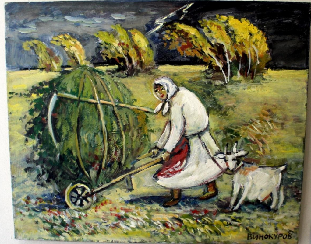
Винокуров В.С. 1949 Гроза 2014 масло, холст Victor S. Vinokurov 1949 Thunderstorm 2014 oil, canvas