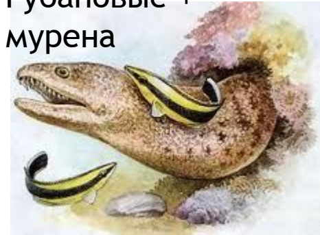
Губановые + мурена