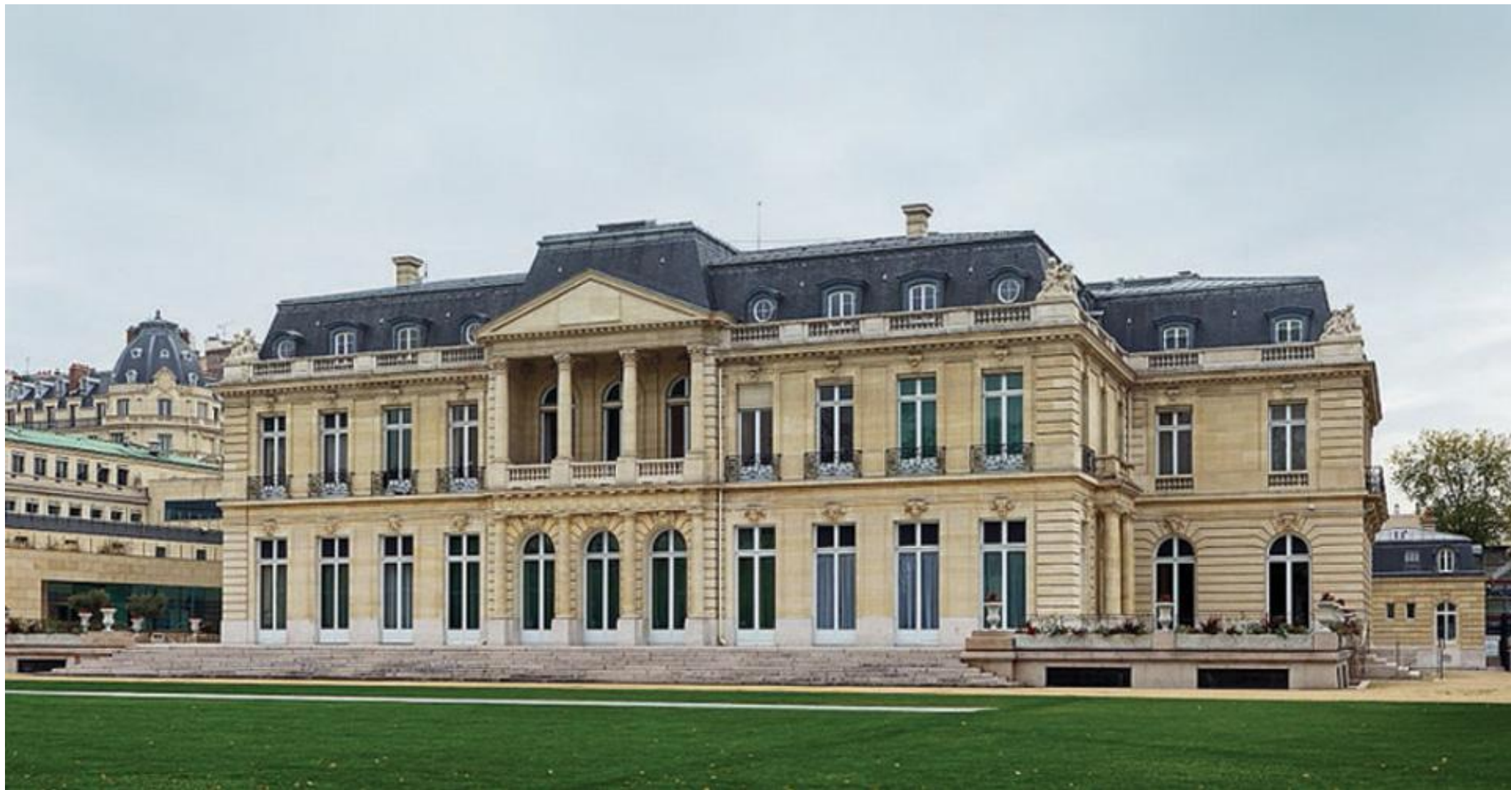
Международная межправительственная организация Штаб-квартира: Париж, Франция Год создания: 1961