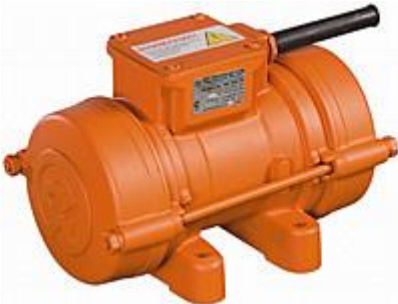
Кең ауқымды вибратор - ИВ 99Б 40/380В