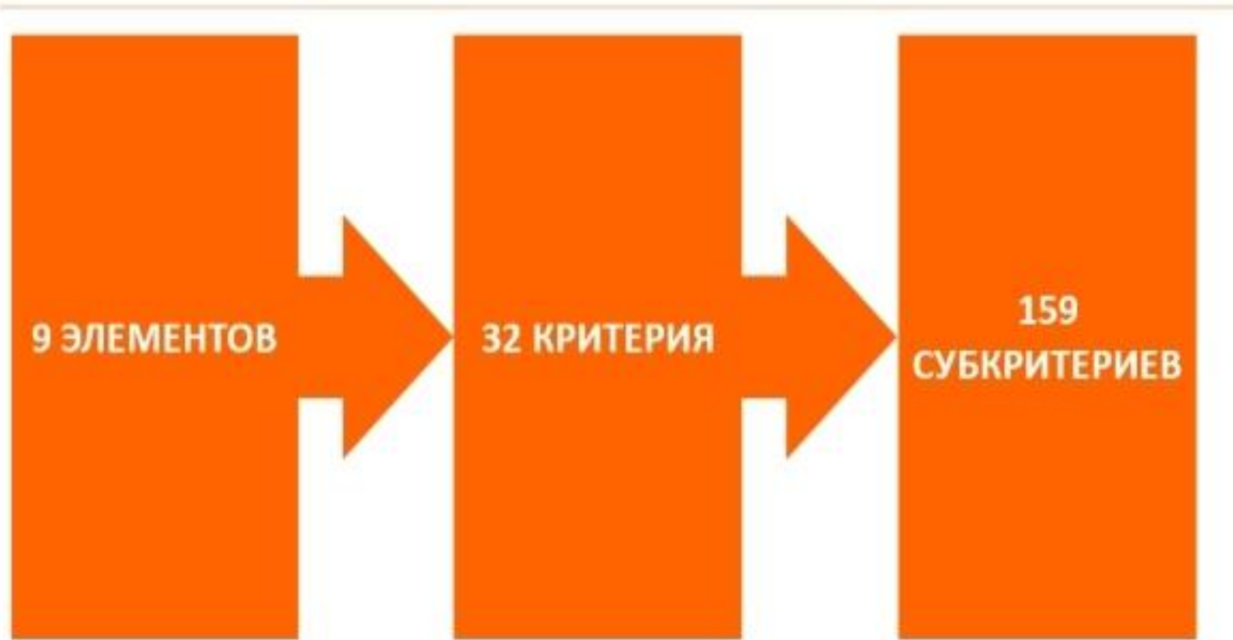
Рис.3 Декомпозиция критериев Модели EFQM