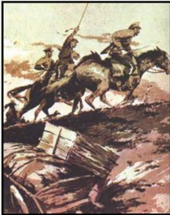
Иллюстрация к «Донским рассказам»

Многие персонажи «Донских рассказов» имеют реальных прототипов, но Шолохов почти всё заостряет, гиперболизирует: смерть, кровь, пытки, муки голода представляет нарочито натуралистически.