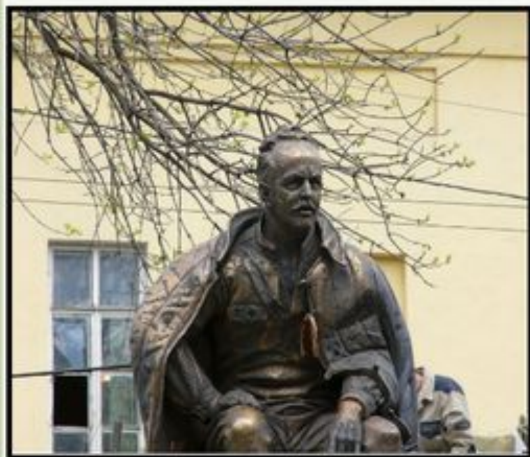
Памятник Михаилу Шолохову в Москве

«Громадная заслуга Михаила Шолохова в той смелости, которая присуща его произведениям. Он никогда не избегал свойственных жизни противоречий... Его книги показывают борьбу во всей полноте прошлого и настоящего...»