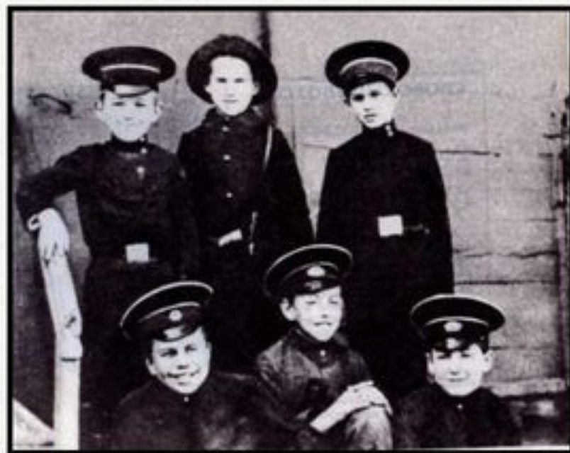
Годы учёбы в гимназии