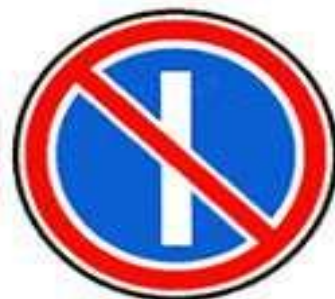
3.29 Стоянка запрещена по нечетным числам месяца