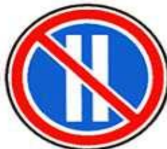
3.30 Стоянка запрещена по четным числам месяца