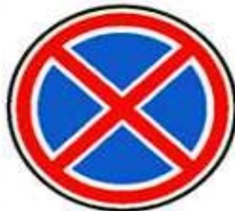
3.27 Остановка запрещена