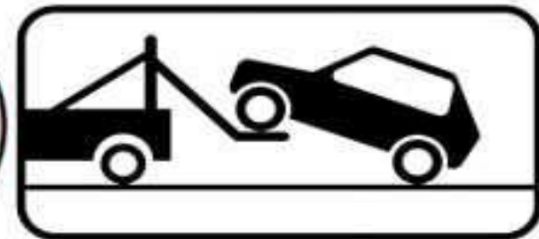
8.24 Работает эвакуатор

Подготовил преподаватель специальных дисциплин: Романов А.Н.