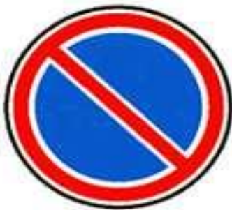
3.28 Стоянка запрещена