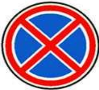
3.27 Остановка запрещена

Заполните таблицу «Ограничения при остановке и стоянке транспортных средств»