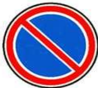
3.28 Стоянка запрещена