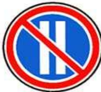
3.30 Стоянка запрещена по четным числам месяца