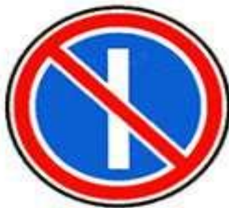
3.29 Стоянка запрещена по нечетным числам месяца