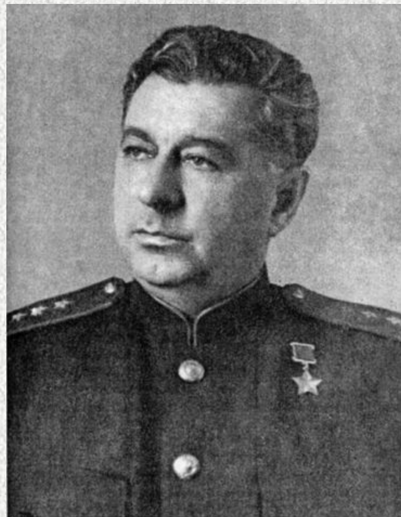
1944 г. Присвоение С. Г. Трофименко звания Героя Советского Союза