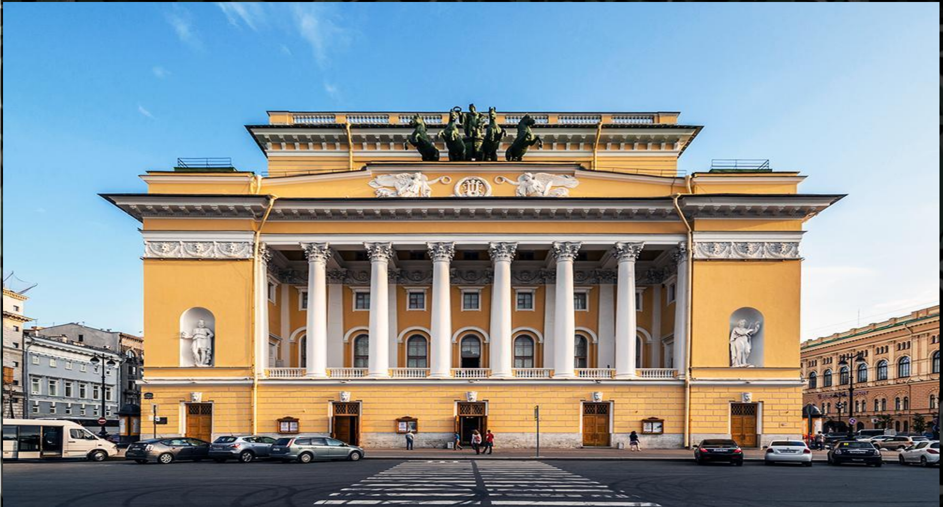
Das Alexandrinsky Theater