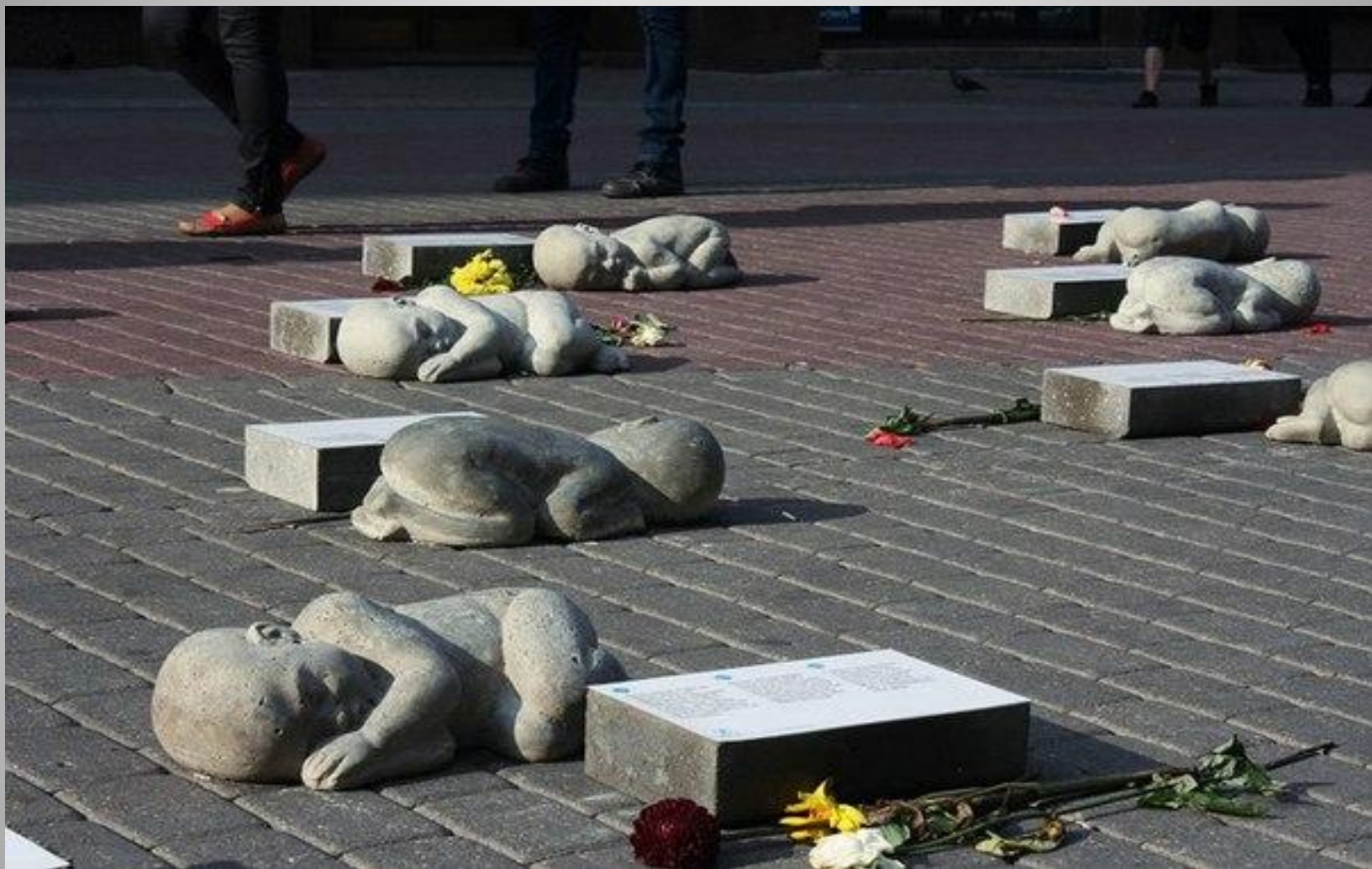
Памятник жертвам аборта в Риге