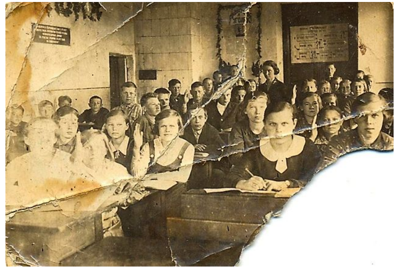
10 а класс на уроках