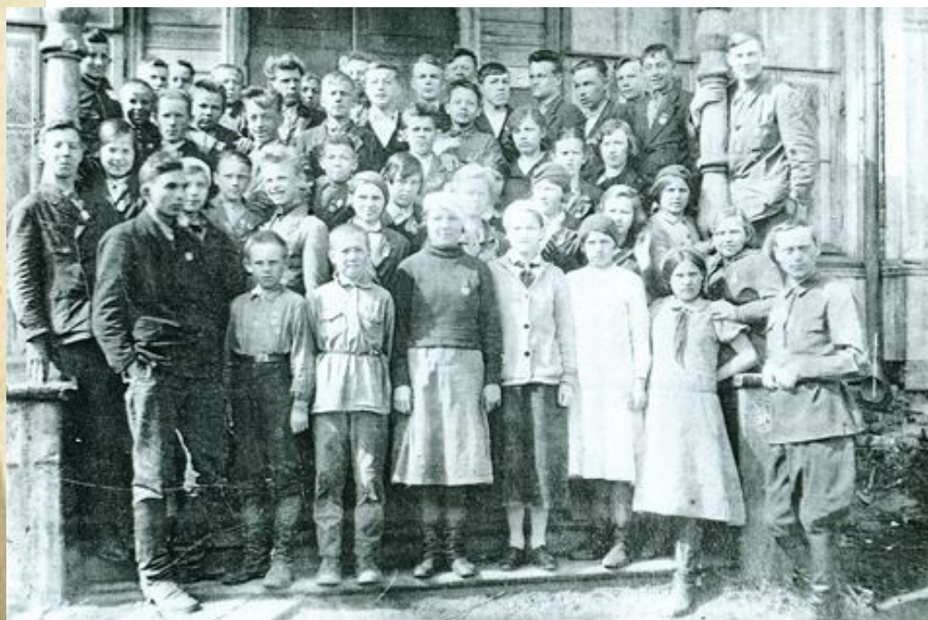
Члены оборонного кружка 1940г.