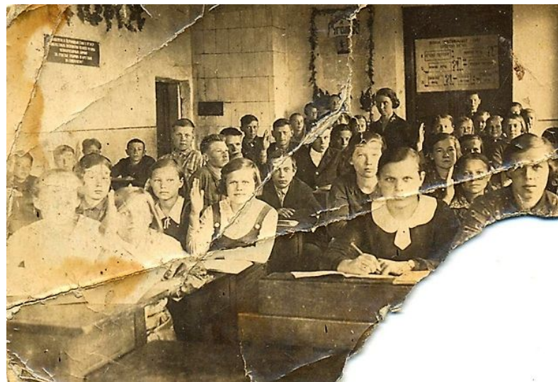
10 а класс на уроках