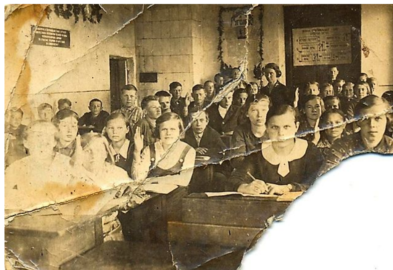
10 а класс на уроках