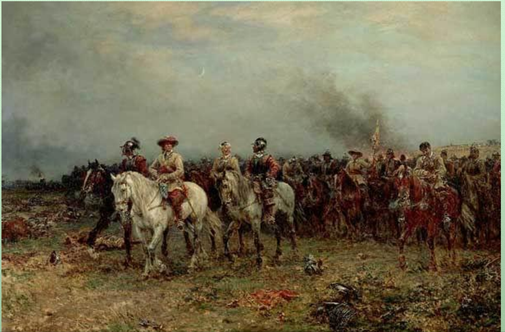
Оливер Кромвель на поле сражения