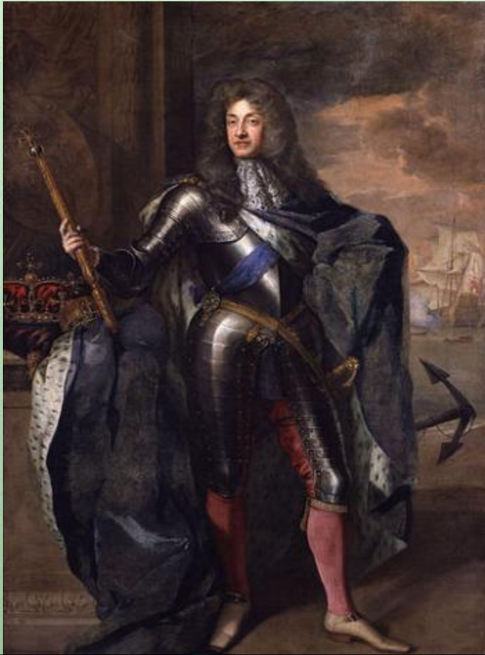
Яков II Стюарт

Сменив на троне брата, Яков II хотел восстановить в Англии католицизм и править как абсолютный монарх. Парламент принял решение лишить его английской короны и передать её правителю Голландии Вильгельму Оранскому