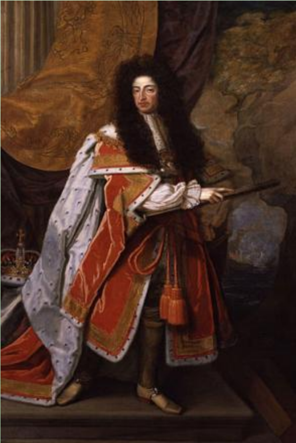
Вильгельм III Оранский