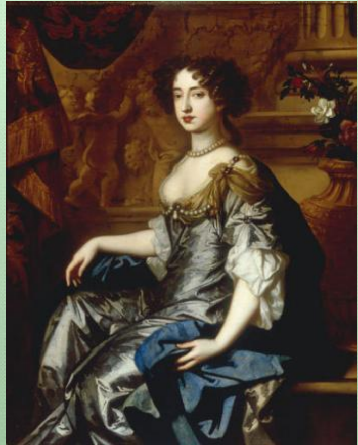
Жена Вильгельма, Мария II