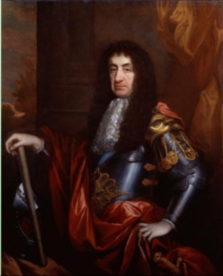
Карл II Стюарт

В 1660 году вновь избранный двухпалатный парламент решил восстановить монархию и пригласили сына казнённого короля занять отцовский трон.